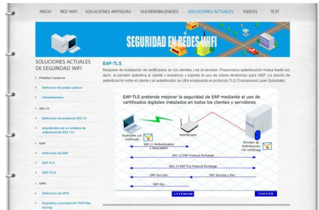
Fig. 5. Pantalla sección soluciones actuales de seguridad.

distinto tipo (Fig. 8), pudiendo visualizar algunas consultas gráficamente (Fig. 9).