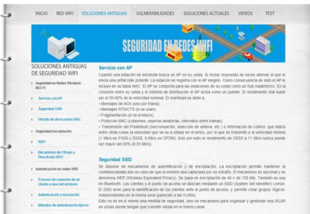
Fig. 3. Pantalla sección soluciones antiguas de seguridad.