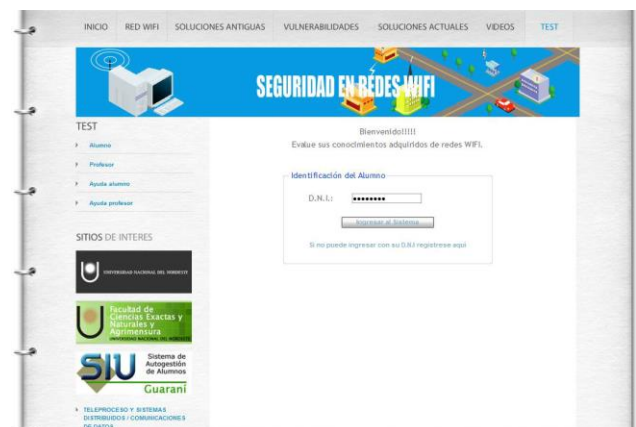
Fig. 7. Pantalla sección test o autoevaluación.