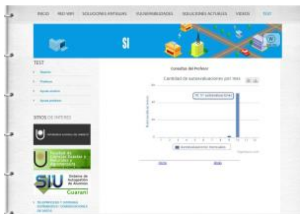
Fig. 9. Pantalla sección gráficos estadísticos.

Se proporcionó una muy buena visualización del contenido animado para poder comprender mejor las vulnerabilidades en las redes WiFi.