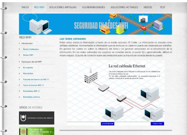
Fig. 2. Pantalla sección Red WiFi.