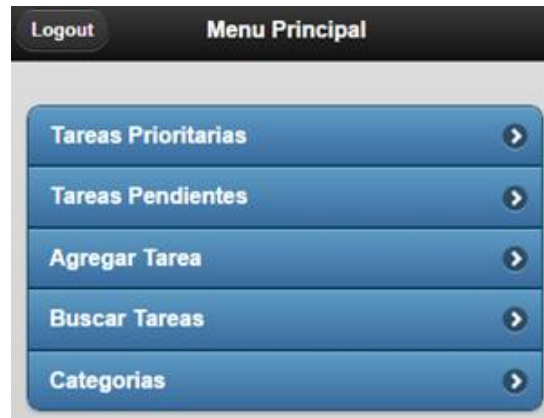
Fig. 5. Pantalla generada automáticamente a partir de un componente del tipo Menu