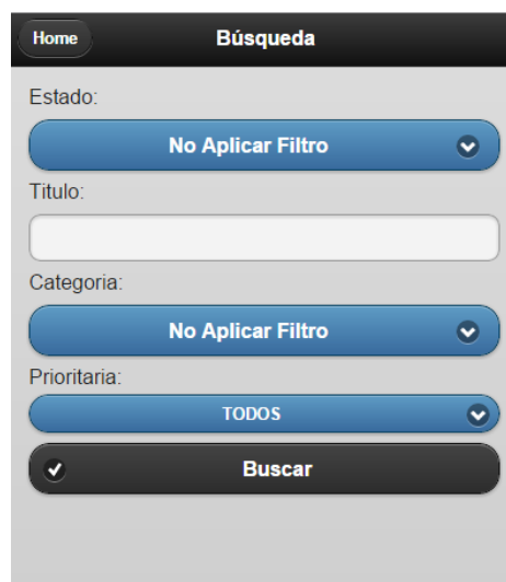
Fig. 4. Pantalla de búsqueda generada automáticamente a partir de un componente Search

La Figura 4 muestra un ejemplo de los filtros de búsqueda que se generan en la interfaz de la aplicación.