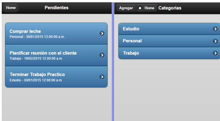
Fig. 3. Pantallas generadas automáticamente a partir de componentes del tipo List

La Figura 3 muestra dos ejemplos de pantallas generadas a partir de componentes del tipo List. La imagen de la izquierda muestra un listado donde la información se presenta en varias líneas, una línea principal con un título y una línea adicional mostrando información complementaria, este caso con la categoría y fecha de vencimiento. En el lado derecho de la imagen se ve un listado con un solo dato mostrando la descripción de las categorías, pero en la barra de navegación además de la opción para volver al menú principal hay un botón para ir a la pantalla que permite agregar una nueva categoría.