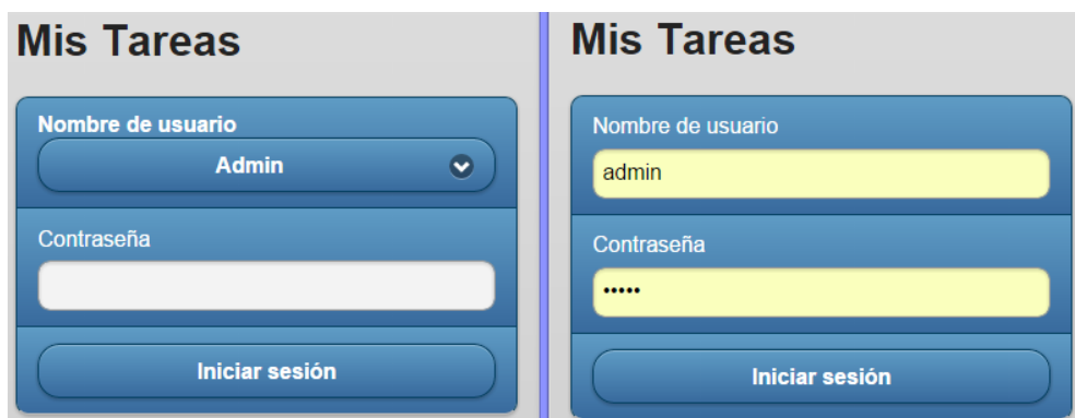
Fig. 2. Pantallas generadas automáticamente a partir de componentes del tipo Login