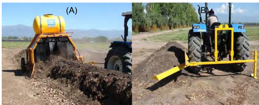
FIGURA 1. Mecanización del volteo de pilas de compostaje. (A) Máquina volteadora (EAA Hilario Ascasubi INTA), (B) Implemento tipo “reja” (EAA Mendoza INTA).