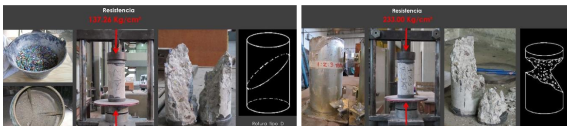
Fig. 6 Ensayos a la compresión. ARQ 111

En el Instituto de Mecánica Aplicada a las Estructuras, IMAE de la UNR: Elección de normas de referencia y técnicas de ensayos sobre lo producido en la actividad 7. Ensayos: rotura, fricción, absorción de las piezas. Análisis de resultados. Ajustes de proporciones en dosajes. Elaboración de informes.