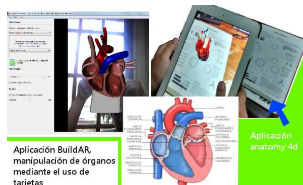
Figura 2. Funcionamiento del corazón: imagen 2D versus recursos RA

La figura 2 muestra las interfaces de las aplicaciones BuildAR y Anatomy donde se observa el trabajo con el corazón. En la primera el alumno al girar la tarjeta puede ver la parte interna y externa del corazón. En la segunda, puede visualizar la parte externa e interna, en detalle cada una de las venas, el flujo sanguíneo, ver los movimientos del corazón y escuchar los latidos, entre otras posibilidades.