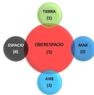
Fig. 1. Integración de Dominios

el dominio aéreo teniendo una vital importancia para la Segunda Guerra Mundial cambiando drásticamente la forma de hacer una guerra; c) Espacio (4): Ya avanzada la década del 60 fue el auge de la carrera espacial dominando así un nuevo campo de batalla muy diferente a los anteriores los cuales están definidos en gran medida por la geografía o radio de operación; d) Ciberespacio (5): Con el advenimiento de Internet desde hace varias décadas, los países (principalmente los desarrollados) se han volcado de lleno a esta nueva era digital en la que todo está interconectado con todo.