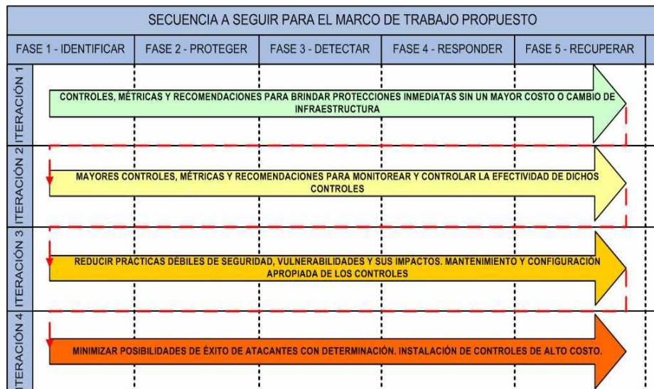
Fig. 3. Secuencia a seguir para el marco de trabajo propuesto

The Critical Security Controls for Effective Cyber Defense [8], logrando así la conformación de una grilla que permitirá ubicar los controles de acuerdo a la fase (Identificar, Proteger, Detectar, Responder, Recuperar) e iteración. Las cuatro iteraciones se clasifican como: a) Logros Rápidos (primera iteración ): Controles, Métricas y recomendaciones para brindar protecciones inmediatas sin un mayor costo o cambio de infraestructura; b) Medidas de Visibilidad y Atribución (segunda iteración): Mayores controles, métricas y recomendaciones para monitorear y controlar la efectividad de dichos controles; Mejora de la Configuración de Seguridad de la Información (tercera iteración ): Reducir prácticas débiles de seguridad, vulnerabilidades y sus impactos, mantenimiento y configuración apropiada de los controles; d) Subcontroles Avanzados (cuarta iteración ): Minimizar posibilidades de éxito de atacantes con determinación, instalación de controles de alto costo.