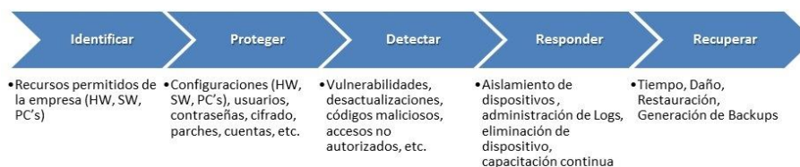
Fig. 2. Fases del “Framework for Improving Critical Infrastructure Cybersecurity”

Sobre la base de controles y el marco de trabajo presentados en la sección anterior, se presenta a continuación la propuesta de un Modelo de Framework que facilite la implementación de controles de manera progresiva y realice un seguimiento de avance a través de las métricas en cada uno de los controles, ofreciendo documentos de consulta por cada control involucrado y links sugeridos. Para esto utilizaremos la división de los controles de seguridad propuestos en Framework for Improving Critical Infrastructure Cybersecurity [11]. Dicho documento plantea una división de los controles de seguridad propuestos en cinco fases. Estas fases aglutinarán controles de seguridad que cumplan con el objetivo de cada fase (ver Fig. 2).