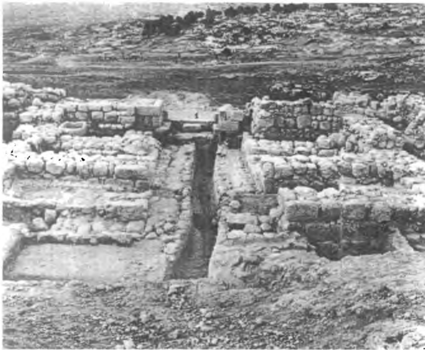
Excavaciones en Gezer, Israel.

aspectos de la vida diaria de los franceses. Donde era posible se acentuaba el derecho natural por encima de los privilegios en boga para un círculo reducido de personas. Una de las innovaciones descollantes que destacaba el vínculo del hombre con la naturaleza, fue la puesta en vigencia de un nuevo calendario, proceso cuya instrumentación la Convención Nacional encargó al presidente del Comité de Instrucción Pública, Ch. G. Romme. Este funcionario confió el estudio técnico de la empresa a un grupo de matemáticos, entre ellos a Monge y Lagrange. El 5 de octubre de 1793 entró en vigencia este calendario con la aclaración de que la Nueva Era había comenzado el 22 de septiembre de 1792, día de la proclamación de la República. En ese día el Sol pasa por el equinoccio de otoño, hecho simbólico que destacaba que un importante fenómeno celeste coincidía con un importante hecho histórico: el nacimiento de la República. Según este calendario, el año empezaba en septiembre en el día del equinoccio de otoño y constaba al igual que el Gregoriano de 12 meses pero de igual duración, 30 días, más cinco días conocidos como