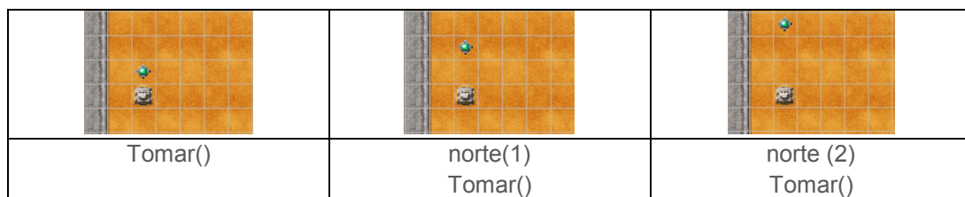
Figura 1. Primer desafío

Para introducir a los alumnos en el desarrollo del SA se les planteó el desafío de tomar la baliza en tres mapas diferentes con una distancia del robot a la baliza distinta en cada escenario. En la Figura 1 se observan las 3 situaciones con las soluciones propuestas por los alumnos.