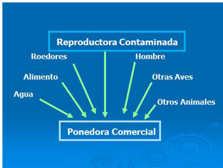
Esquema 1. Posibles fuentes de contaminación con Salmonella de plantales avícolas.

Asumamos que las aves reproductoras llegan a nuestros países libres de las Salmonellas Pullorum, Gallinarum, Enteritidis y Typhimurium (según el país pueden incluirse otras) porque así lo