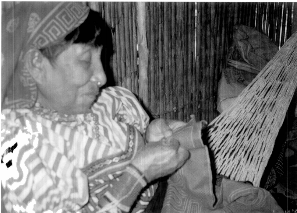
Mujer Kuna cosiendo Mola.

Las mujeres kuna tienen una vestimenta de uso cotidiano, muy colorida.