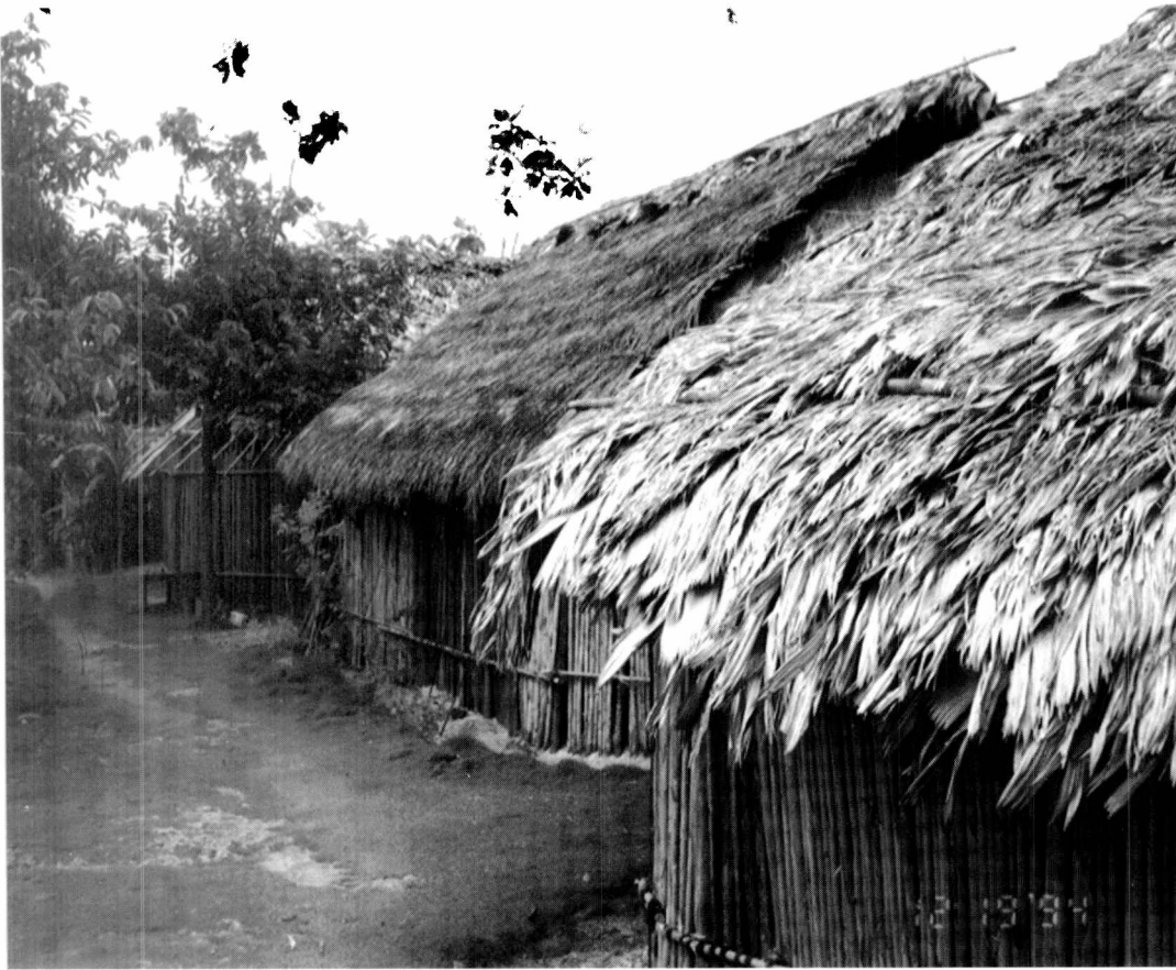
Viviendas típicas de la isla de Tikantiki.

choza común con la familia de su mujer y trabajar para colaborar en la manutención de todos ellos.