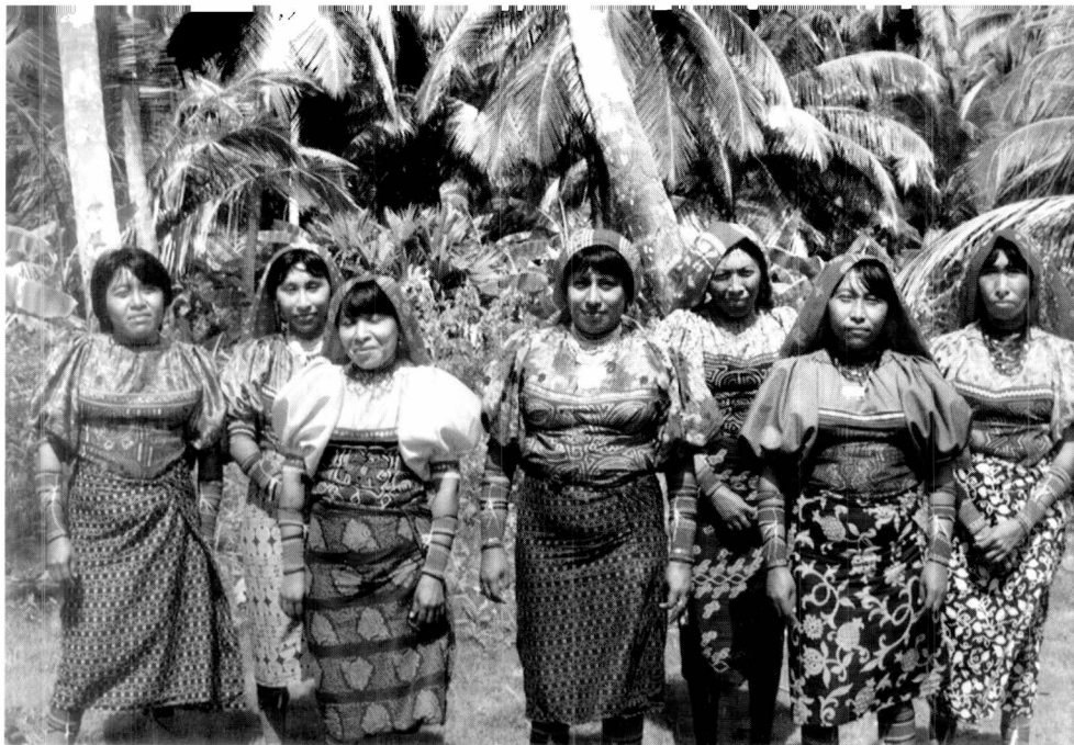
Mujeres Kuna con las vestimentas para las fiestas de Navidad.

Lo primero que me impactó cuando llegué fue el orden en la distribución de las viviendas y la limpieza reinante. Las chozas están construidas con cañas y palos que sostienen el techo cerrado con hogas de palmera. En el interior no hay mobiliario, sólo se ven algunos canastos y hamacas o coys que utilizan para dormir.