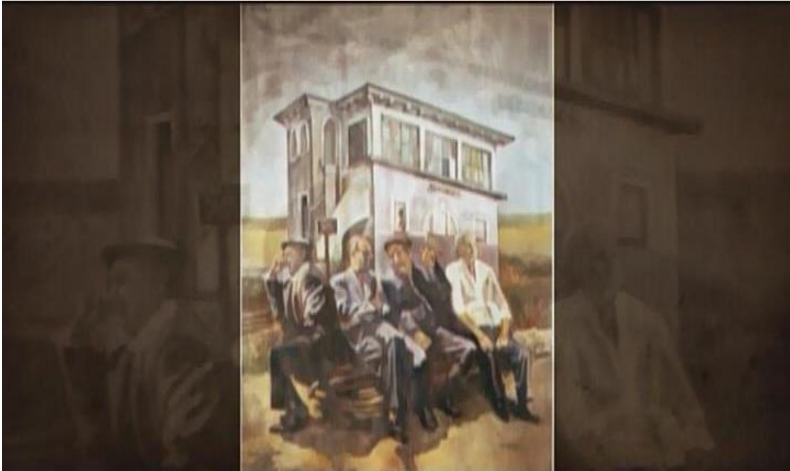
Imagen IV: Pintura de Carlos Bernasconi, cedida a los creadores de "Soy por el tren (o no soy)"

Si bien gran parte de las doctrinas artísticas conjugan esa mezcla de sensaciones y permiten al realizador audiovisual valerse de ellas para transmitir una infinidad de sentimientos, el potencial expresivo de la música es invaluable. Su capacidad para crear ambientes y comunicar emociones han constituido a este lenguaje universal en una gran herramienta a disposición de los documentalistas y del cine en sí mismo, que ya desde sus inicios tuvo una alianza estratégica con melodías que amenizaban las proyecciones del cine mudo.