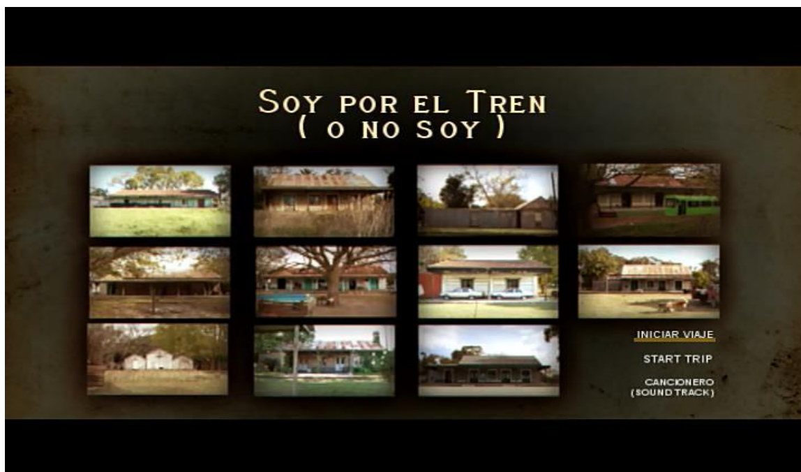
Imagen 1: Menú Inicio del documental “Soy por el tren (o no soy)”