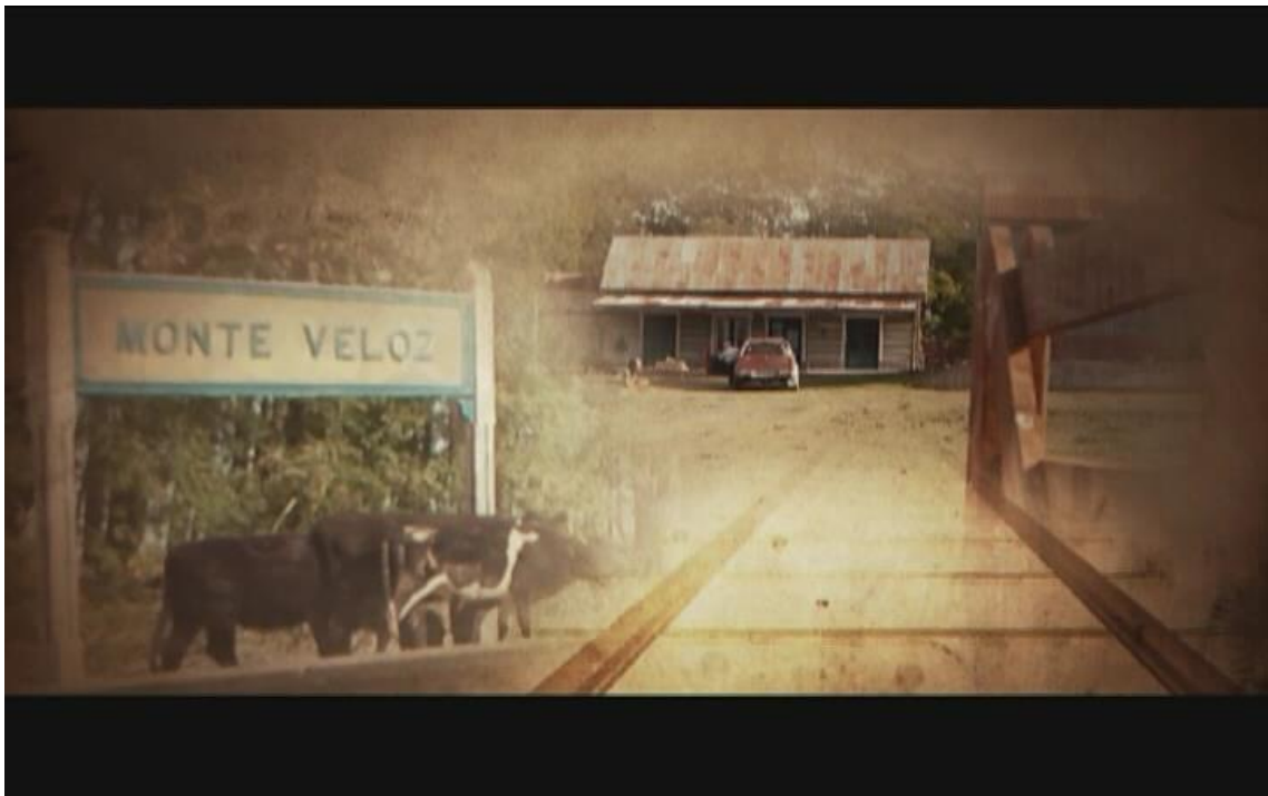
Imagen II: Montaje fotográfico que forma parte del videoclip “Sueños de tren”, creado para “Soy por el tren (o no soy)”

Y fue por eso que, tanto analógica como digitalmente, las tomamos. Para luego incluirlas en el producto audiovisual, gracias a la posibilidad que nos daría la edición del material. En esa instancia, para la que aún restaban varios kilómetros, montaríamos las fotografías, generando un espacio donde se enlazarían unas con otras ( en el documental: videoclip “Sueños de tren” ).