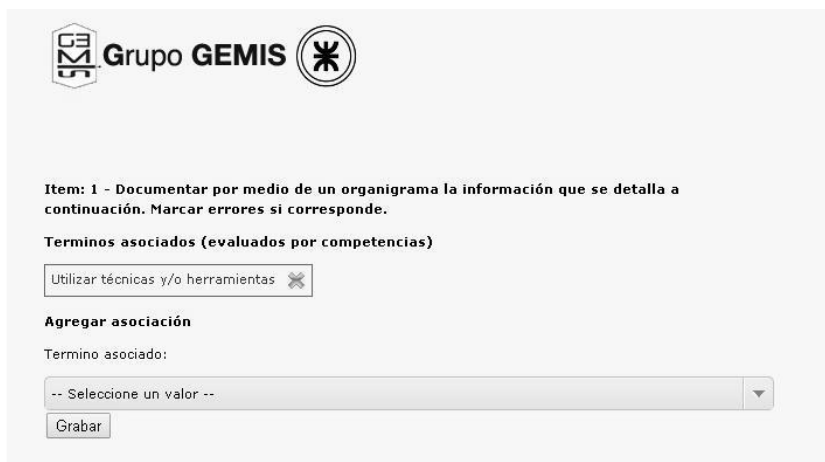
Fig.4. Interfaz de análisis de evaluaciones.