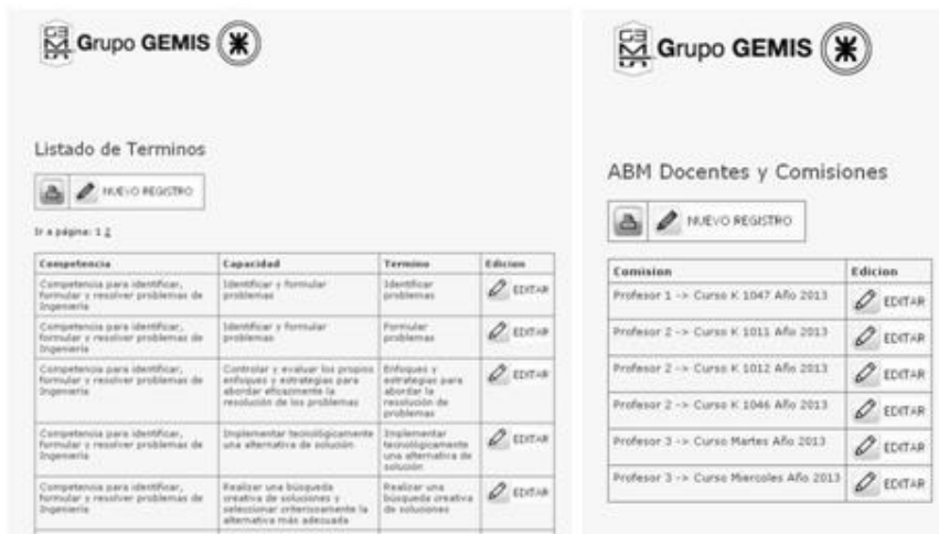
Fig. 2. Interfaces de administración.

La aplicación se encuentra organizada en tres módulos: administración general; administración de las evaluaciones y reportes. En el primer módulo el administrador puede realizar las configuraciones de competencias, capacidades y términos asociados y puede configurar los docentes y las comisiones (figura 2).