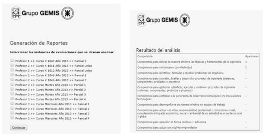
Fig.5. Interfaces de generación de informe.

Finalmente, en el módulo de reportes se encuentra una interfaz donde se puede realizar el filtrado de los instrumentos de evaluación a analizar y el informe propiamente dicho (figura 5).