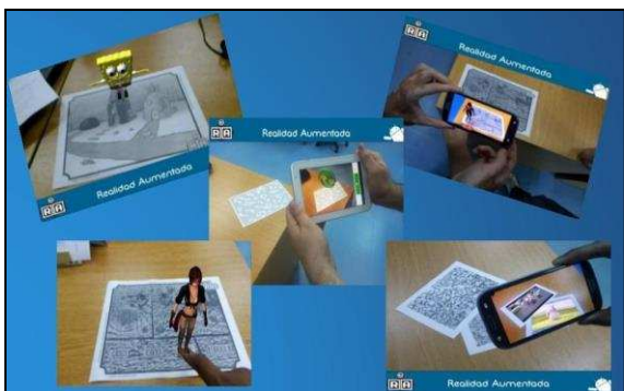
Figura 1. Aplicaciones Demos, Modelo 3D, Botón Virtual y Video

Como se puede observar en la figura 1, estas aplicaciones abordan distintos aspectos de la realidad aumentada, tales como el reconocimiento de distintos tipos de marcadores, renderizado de imágenes, videos y objetos en 3D. Al fusionar estos elementos sintéticos con elementos de la realidad en la que nos encontramos, se logró una experiencia de realidad aumentada enfocada en la interactividad con el usuario