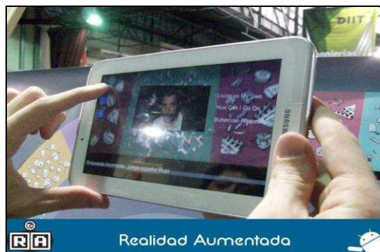
Figura 3. Dispositivo móvil-usuario eligiendo una opción luego de la reproducción de video.

El usuario aumenta la realidad del tablero físico de juego a través de su dispositivo móvil el que corre la aplicación Jugar seleccionado marcadores temáticos correspondiente a las categorías de las preguntas, que contiene los videos de contenidos con los que interactúa el usuario en un ambiente de realidad aumentada, se muestra una imagen en la figura 3.