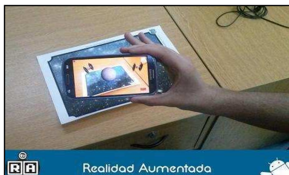
Figura 4. - Aplicación Imperio Re Contraataca

Otra aplicación desarrollada en el marco de la línea de investigación fue el Imperio Re Contraataca, se muestra en la figura 4 una imagen del mismo. Básicamente se plantea un combate espacial.