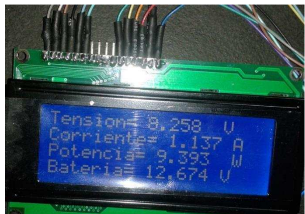
Ilustración 3. Capturas transmitidas por el sistema

El código C implementado como firmware, se basa en el diagrama de flujo mostrado en la ilustración 2.