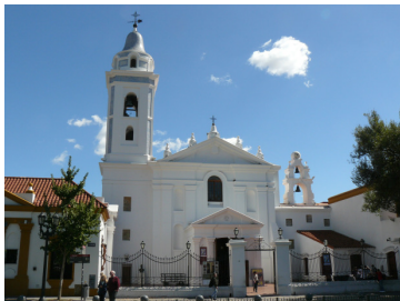
Figura 1: Convento de La Merced, aspecto actual, fotografía propia 2012.