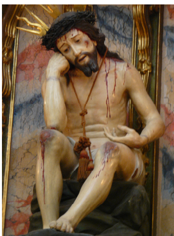
Figura 4: José el misionero, Jesús de la humildad y paciencia , talla en madera policromada, siglo XVIII.