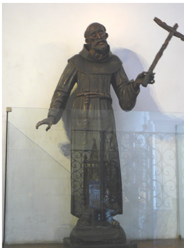
Figura 2: Alonso Cano (atribuida), San Pedro de Alcántara , talla en madera policromada, siglo XVIII, fotografía propia 2012.