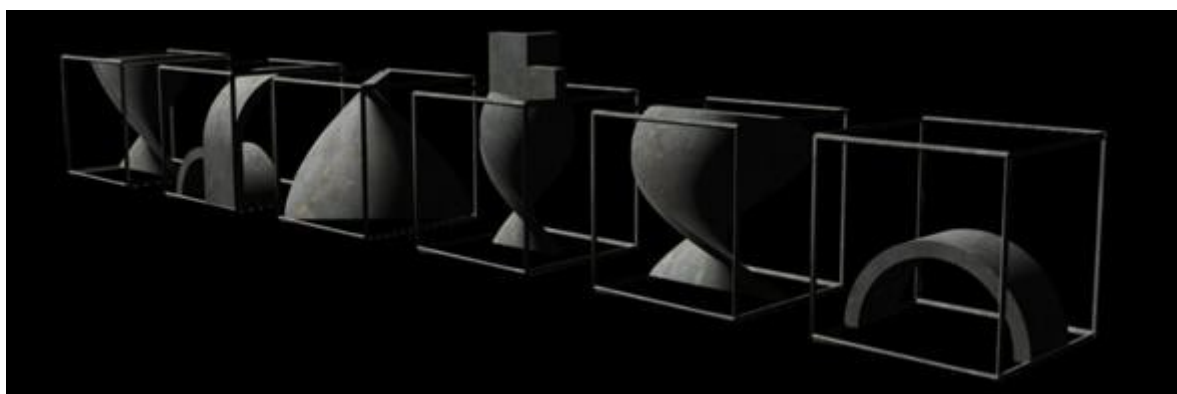
Juego de ajedrez "Esencia", autor Iván Martínez, Cosicidad, 2005, Di. Faud, UNSJ

El Peón fue la última de las piezas en ser generada, quizás porque la simpleza de su movimiento hacia mas complejo su abordaje, sobre todo teniendo en cuenta su presencia en el tablero (la mitad de las piezas son peones). Se busco una imagen contundente, que reflejara cierto sacrificio y