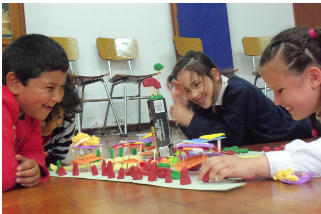
Diseño participativo de plaza Italia de la Ciudad de La Plata.

En los talleres de esta segunda etapa, profundizamos la temática urbana. Desarrollamos el concepto de ciudad. Trabajamos con nociones generales de la Ciudad de La Plata, estructura general y trazado. El trabajo lo abordamos, en principio, desde lo intuitivo y desde el conocimiento que los alumnos poseen, para luego sí presentarles el mapa real de La Plata, desarrollar conceptos y traducir mapas visuales a mapas táctiles. Todas las experiencias fueron georeferenciadas y materializadas en cartografías táctiles y maquetas. Sintetizamos las experiencias en un mapa colectivo. Construimos una imagen mental de la ciudad por medio de la materialización de los planos.