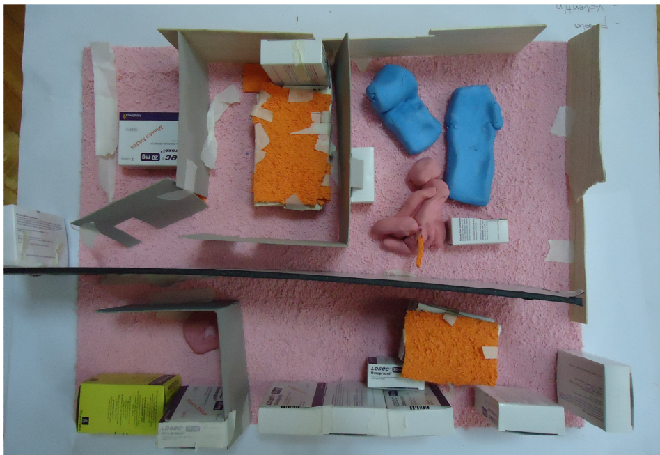
Diseño de viviendas colectivas.

FASE 2. DIAGNOSTICO DE LA CIUDAD Y CAPACITACION EN CARTOGRAFIAS Y MAQUETA: En esta etapa realizamos diversas actividades para familiarizarse con los conceptos y las técnicas propias de la elaboración de cartografías y maquetas con el fin de retratar la realidad percibida y construir un instrumento de configuración del espacio urbano. Por medio de jornadas de trabajo en cada institución, diagnosticamos el espacio urbano cotidiano, sus diferentes recorridos. Una vez identificados los elementos más relevantes y las diferentes maneras de percibirlos, realizamos un