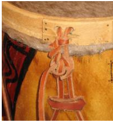
Bombo legüero (detalle)