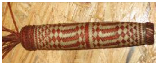
Cabo de cuchillo (dos tonos)