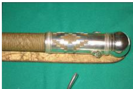
Rebenque con remate de plata