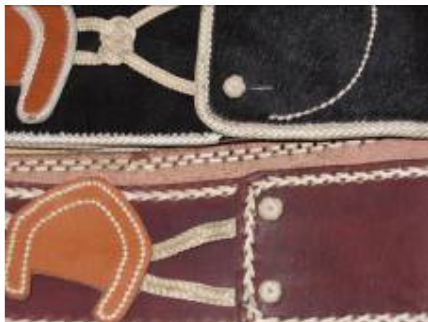
Rastra o tirador

En un recorrido entre artesanos se han podido algunas muestras de tipologías de productos utilitarios, éstas responden a regiones diversas del país, en las que costumbres, recursos materiales, y básicamente antecedentes culturales, han incidido en sus características particulares.