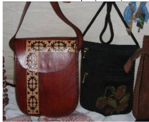
Carteras (baqueta repujada y grabada)