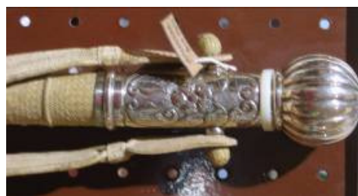
Rebenque con remate de plata