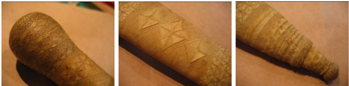
Cabo y vaina de cuchillo (detalles)

Es frecuente observar el agregado de otros materiales, en general metales preciosos o semipreciosos como oro, plata, alpaca, y en ocasiones monedas valiosas, sobre los cuales hay aplicadas labores artesanales de gran calidad y precisión que en muchos casos requieren elevadas experiencias técnicas.