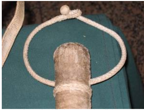
Arreador / Rebenque (detalle)