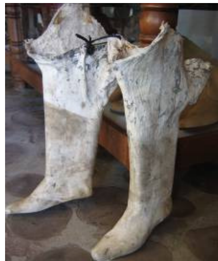
Botas de potro (cuero crudo equino moldeado)