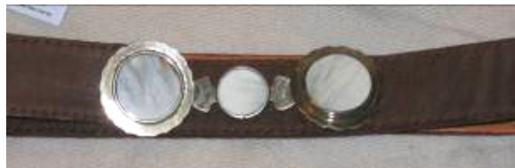
Cinturón con aplicaciones de metal (plata)