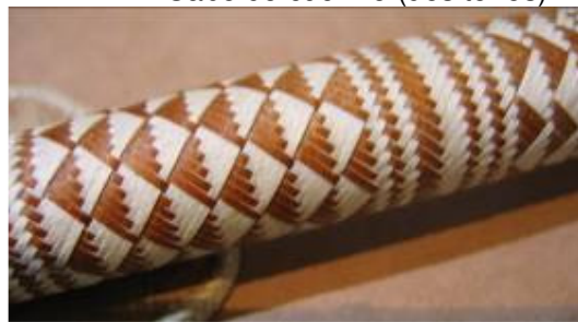
Cabo de cuchillo (dos tonos)