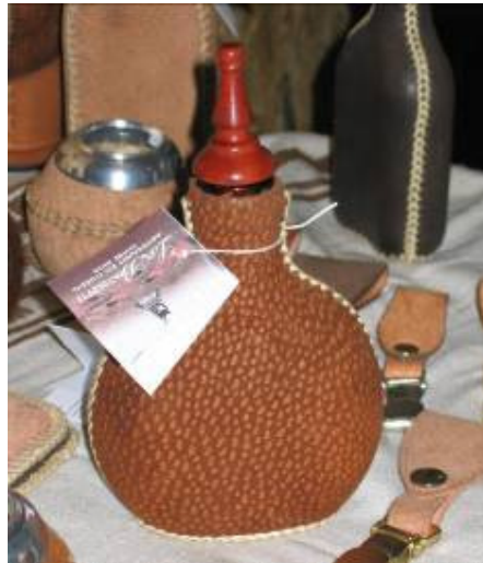
Petaca en cuero de carpincho