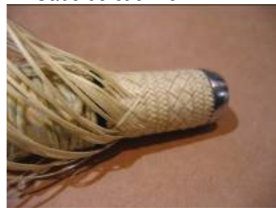
Cabo de cuchillo (en proceso)