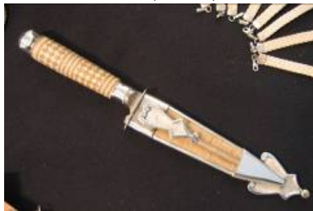
Cuchillo con detalles de plata en vaina y cabo con remate (detalle)