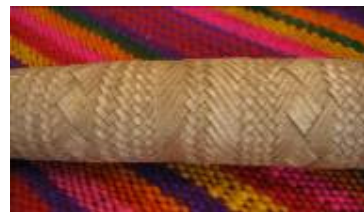
Cabo de cuchillo