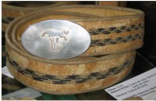
Cinturón con hebilla de plata