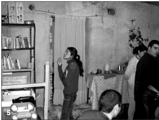
5. Comedor. 6. Casa de S.