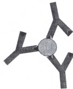
IgG asimet.(no ppte) + Ag (bloqueo del Ag)