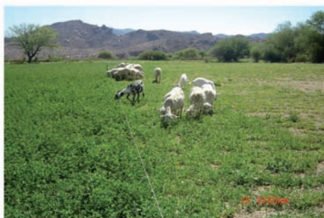
Imagen 5: suplementación en baches forrajeros

Entre las razas introducidas podemos mencionar Braford, Aberdeen Angus y Brahman (para el caso de los bovinos) y Corriedale, Hampshire Down y Manchego (para el caso de la ganadería ovina)