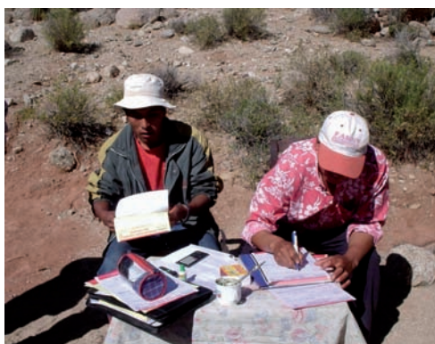
Imagen 7: Realización de actas de vacunación por parte de miembros de la comunidad.

Las acciones llevadas a cabo se enmarcaron en actividades de reuniones de planificación, reorganización y acreditación, por parte del SENASA, de vacunadores elegidos de manera democrática en cada comunidad (poniendo en valor las capacidades adquiridas en todo este tiempo de trabajo previo). Tal es así que se asume el control de la campaña: precio de la dosis, definición de fechas (dentro del plazo de la campaña), elección de vacunadores, lugares estratégicos de vacunación para disminuir los tiempos de arreos, etc. 7