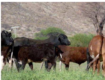
Imagen 6: tropa mejorada

Entre las razas introducidas podemos mencionar Braford, Aberdeen Angus y Brahman (para el caso de los bovinos) y Corriedale, Hampshire Down y Manchego (para el caso de la ganadería ovina)