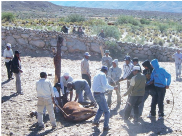
Imagen 2: sistema tradicional de manejo de hacienda.

familias representa el único capital de las mismas, así como el mayor ingreso monetario familiar.