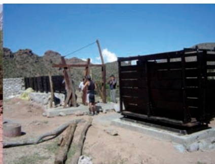
Imagen 4: Sistema de Bascula y Manga