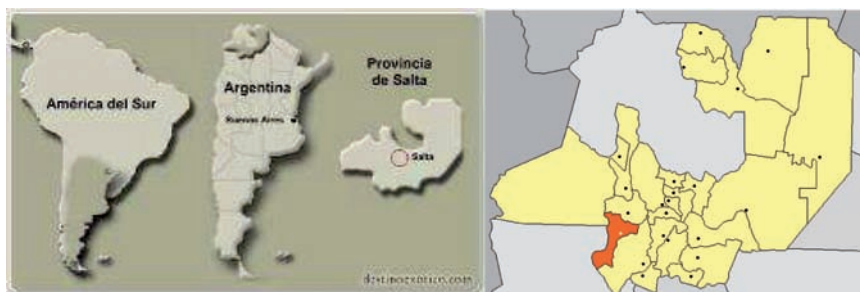
Imagen 1: mapa del departamento de Molinos.

Para llegar al mismo se deben recorrer 190 kilómetros desde la capital salteña por caminos sinuosos de ripio y cornisa, hasta converger en la ruta nacional N° 40.