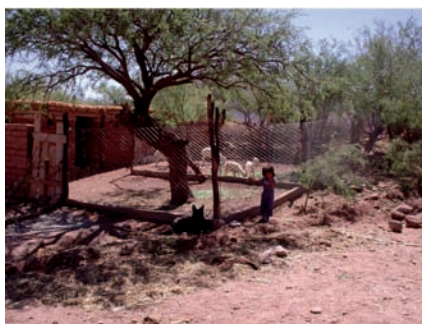
Imagen 3: refugios para pariciones

De esta manera se comenzó a trabajar en la construcción de corrales mejorados (refugios para pariciones, corral de aparte, cercos perimetrales, bebederos, etc.) sistemas de manga y bascula, estacionamiento de servicios, suplementación en baches forrajeros, manejo del destete e introducción de genética.