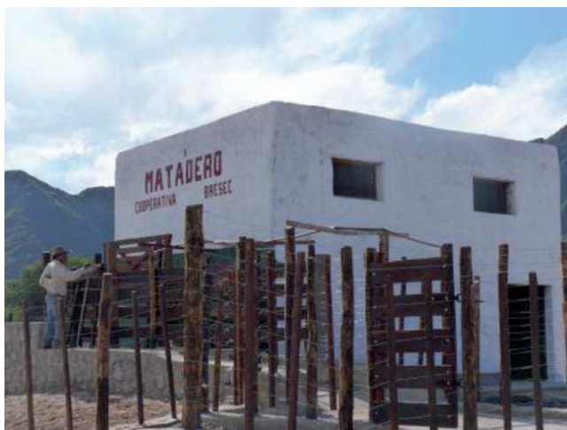
Imagen 10: instalaciones de la planta de faena: Cooperativa Bresec