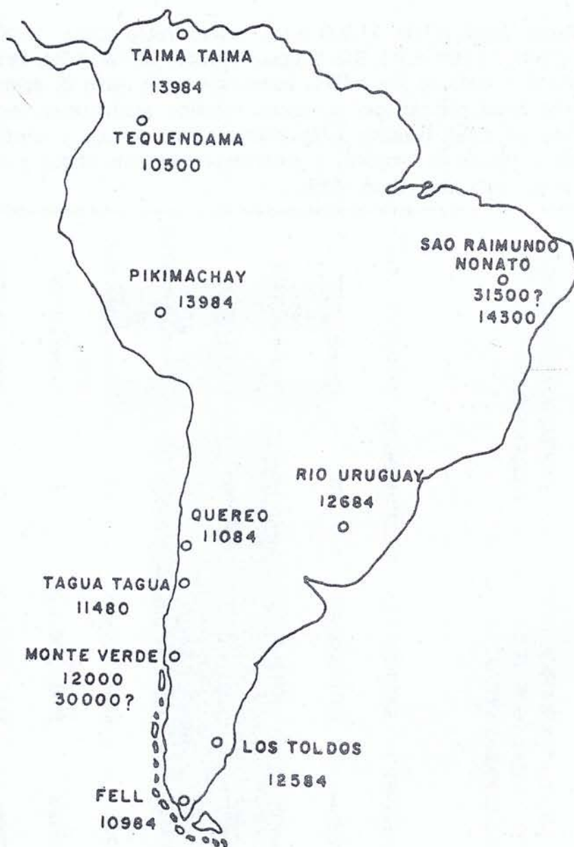
Figura 1: Sitios arqueológicos paleoindios.

Las favorables condiciones ambientales habrían permitido a los paleoindios expandirse en forma relativamente rápida en búsqueda de mamíferos pleistocénicos que habrían constituido su base alimenticia. Es así como la casi totalidad de los sitios tempranos descubiertos en Sudamérica están localizados en zonas que, por una parte, eran probablemente los hábitats naturales de las grandes presas, y por otra eran aptos para la caza en grupos (Lynch 1983). En los sitios de caza y faenamiento, como Taima Taima (Venezuela, 14.000