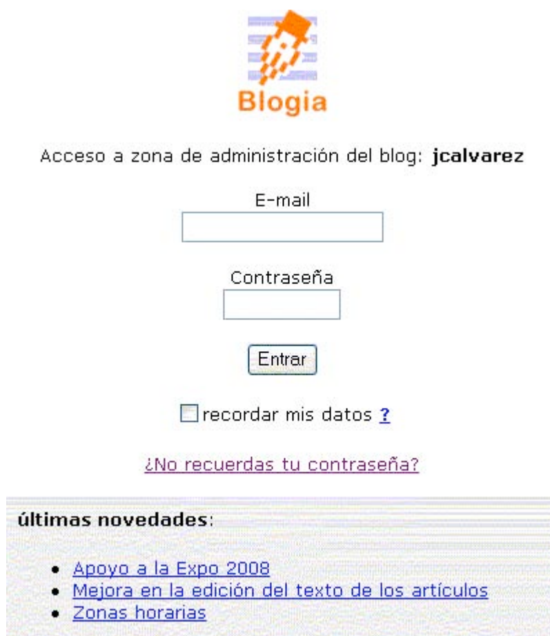
Figura 6. Pantalla de validación.

De nada nos servirá habernos dado de alta en un proveedor de blogs si no introducimos contenidos, sería como tener nuestro diario immaculado. Para hacer modificaciones en nuestra página, principalmente escribir o borrar artículos, aunque también otras opciones como su aspecto, hay que elegir el enlace “administración” de la parte inferior de la página principal, lo que nos llevará a la página de validación de la figura 6, en la que se nos pedirá correo y contraseña.