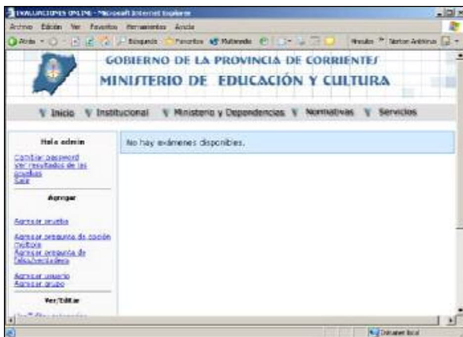
Figura 2. Panel de administración.