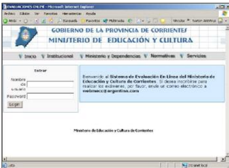
Figura 1. Interfaz inicial

Perfil Profesor. Los usuarios que pertenecen al perfil profesor son dados de alta por el administrador del sistema, quien otorga los permisos de administración para una determinada categoría de preguntas y un determinado grupo de usuarios. La figura 3 ilustra la interfaz para agregar nueva pregunta al examen.