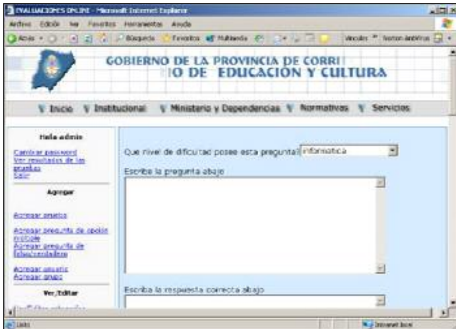
Figura 3. Agregar una nueva pregunta

Perfil Alumno. El alumno puede ser dado de alta tanto por el Administrador del sistema como por el profesor responsable del grupo al que pertenece el alumno. Una vez que el alumno ha ingresado al sistema visualizará el listado de exámenes disponibles. Haciendo un clic en un examen, se accederá al mismo (Fig. 4). Al finalizar el examen, el sistema automáticamente muestra el porcentaje de aciertos en las preguntas. En la Figura 5 se observa la interfaz de las calificaciones obtenidas por el alumno.