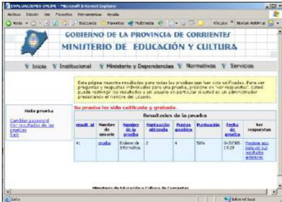
Figura 5. Interfaz de visualización de los resultado de un examen