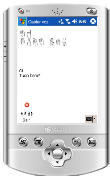
Figura 3: Módulo Comunicação.

Por fim, além de o sistema auxiliar o aluno durante todo o processo de alfabetização disponibiliza, ele também o acompanha ao longo de sua vida, auxiliando-o no processo de interação com a sociedade, através, principalmente, de dispositivos móveis. Por exemplo, enquanto um deficiente auditivo ou surdo estiver utilizando o sistema ao se comunicar com um ouvinte, tudo o que está sendo dito pelo ouvinte aparece para o deficiente auditivo ou surdo, em seu dispositivo, em Libras e em forma de texto na Língua Portuguesa, como demonstrado na Figura 3.