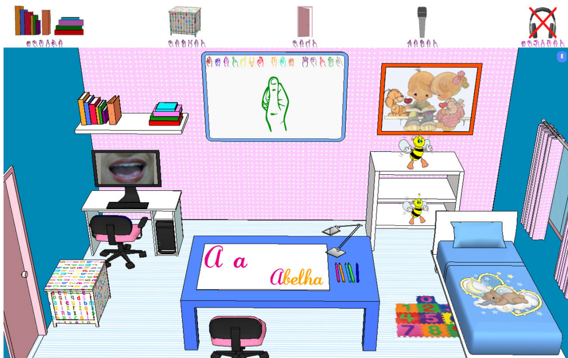
Figura 1: Representação de Fala.

De forma geral, o funcionamento do Hearing the World dá-se a partir do momento em que o educador pronuncia uma letra/palavra em um microfone (acionado por uma tecla do teclado). A partir disto, o som captado é representado, na tela do computador, relacionado à imagem, palavra, símbolo (Libras), sílaba, além de uma animação simulando a pronúncia através dos movimentos labiais, sendo cada item apresentado de acordo com o contexto. Por exemplo, ao ser pronunciada a letra 'A', o sistema apresenta a própria letra, uma palavra que a identifica (como por exemplo, abelha), uma imagem correspondente à palavra, a representação da letra em Libras e, por fim, uma simulação do movimento labial pronunciando tal letra, como ilustrado na Figura 1. Uma vez que sem Libras o aluno tem que se concentrar apenas na leitura de lábios e 50% da mensagem se perde, a representação do movimento labial é um dos fatores essenciais para garantir que o objetivo do sistema seja atingido, enquanto o aluno não possui domínio sobre Libras.