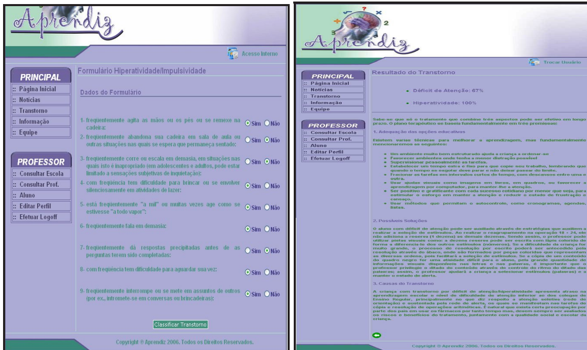
Figura 5 e 6: Tela onde é aplicado o formulário para classificação do transtorno e Apresentação do resultado da classificação do transtorno.

Os formulários serão aplicados aos professores, que são os responsáveis por preencherem as questões impostas para cada aluno que tem relação com o mesmo. Algumas das questões, referente aos formulários para obtenção dos dados, são apresentadas na Figura 5.