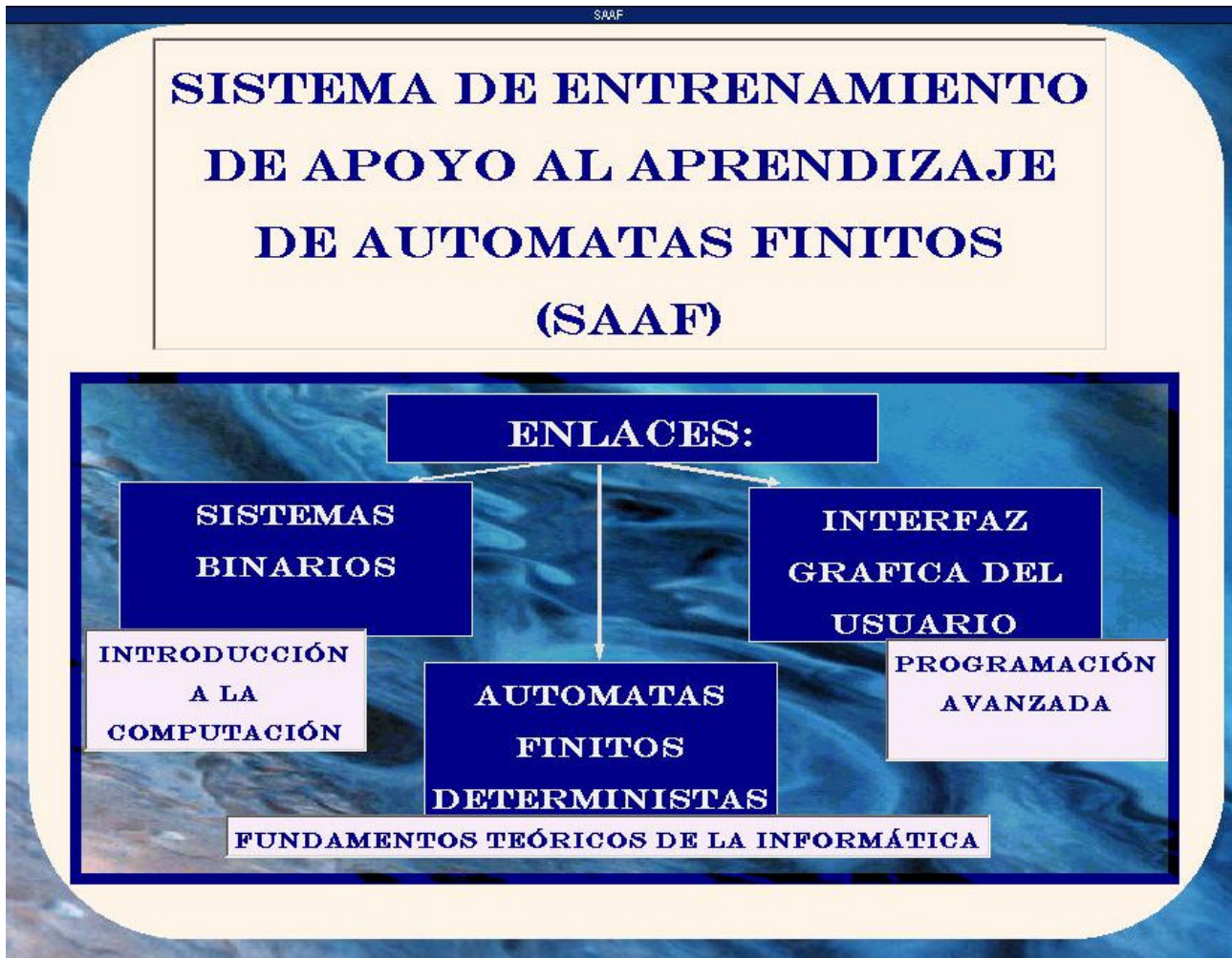
Figura 1. Presentación del sistema SAAF

2.1. Opción 0 “Presentación”: pone a disposición del estudiante las siguientes palabras claves: “Sistema binario”, “Autómata finito”, “Interfaz grafica del usuario”. Asocia cada una de ellas, a las materias en las que las han estudiado. Si el alumno selecciona estas palabras claves, accede a una definición de cada una de ellas, destacando las fuentes bibliográficas.