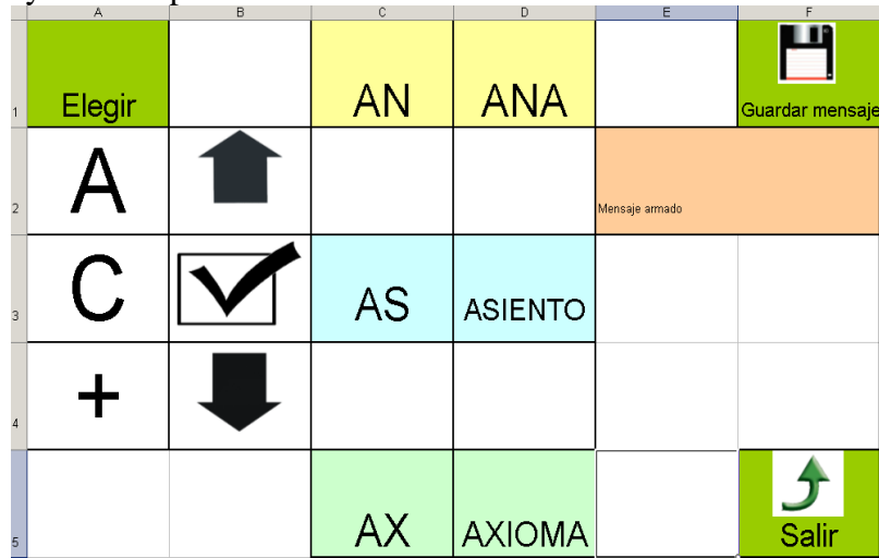
fig. 3 Tablero para escribir los mensajes

El tablero tiene comandos como en los ángulos derecho, superior e inferior para guardar el mensaje construido y salir respectivamente.