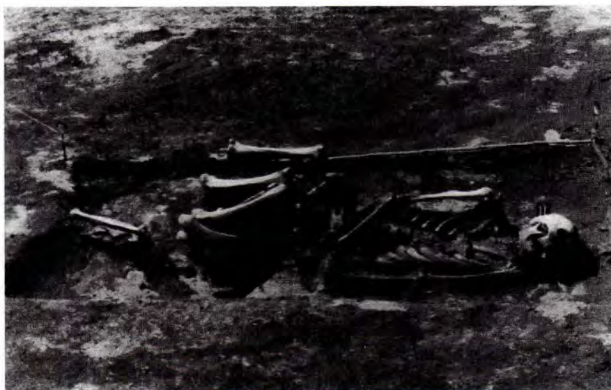
Foto 2. Las Mandíbulas. Vista del sitio durante la excavación.