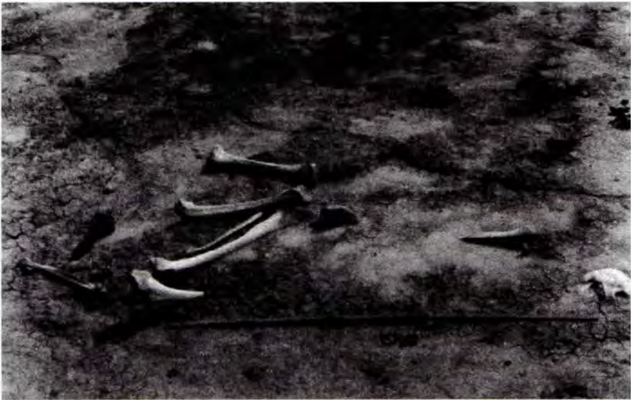
Foto 1. Las Mandíbulas. Vista del sitio donde se recuperó el esqueleto completo.

En la tabla 3 se observa, en la última columna, que la mayoría de los materiales se concentran en los grados 0 y 1 de meteorización. Un perfil de meteorización más alto se registró en el sector norte, en superficie (localidad Las Mandíbulas). En el caso de los materiales de excavación, los que presentaron Grado 1 de meteorización son solamente aquellos que afloraban en la superficie en el momento de su descubrimiento.