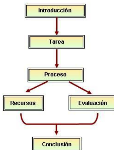
Figura1 etapas de una webquest

Las WebQuest es una metodología de aprendizaje por descubrimiento, simple y valioso para propiciar el trabajo desarrollado por los alumnos utilizando los recursos de la WWW. Es un proceso de indagación e investigación a través de Internet. Una WebQuest [11] se estructura en torno a las siguientes etapas, que se muestran en la figura siguiente.