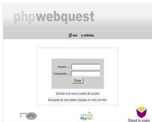
Figura4: pantalla principal

En la figura 4 se muestra la pantalla principal en la cual se visualiza en la parte inferior derecha, el acceso al manual de usuario.