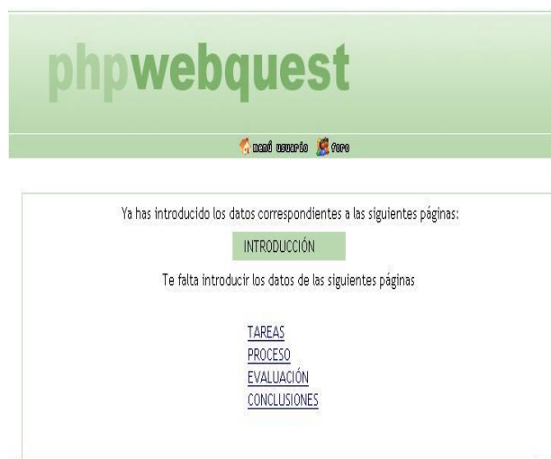
Figura2: pantalla original de la webquest

incorporada dentro de la etapa proceso. En este ejemplo la etapa Introducción ya ha sido desarrollada y por ende no puede ser modificada hasta que no se concluya la creación de la webquest completa. Esto se debe a que el programa no contaba con la posibilidad de volver a editar una etapa cuando esta ya había sido concluida, necesitando para ello un link de acceso.