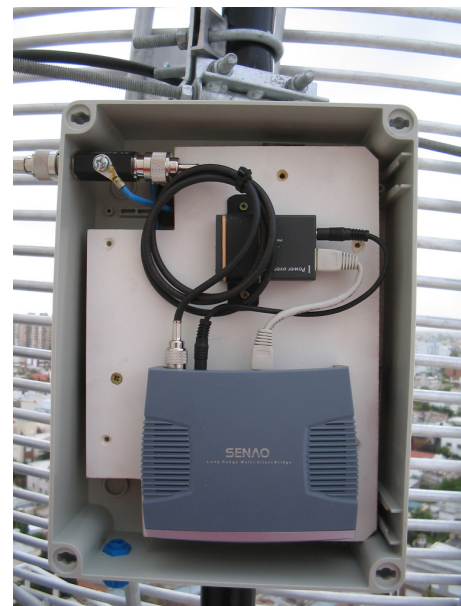
Fig. 2 Foto del equipo WiFi montado en la caja estanca

En el otro extremo, en el exterior de la escuela hay un equipamiento similar: un punto de