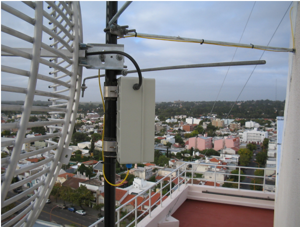
Fig. 3 Vista del gabinete estanco montado detrás de la parábola.

acceso WiFi y una antena parabólica. En este caso la otra conexión del equipo WiFi se conecta a una computadora o a una red de ellas.