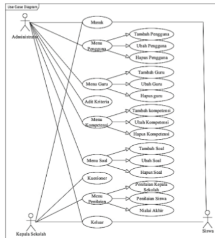
Gambar 2. Use Case Diagram Aplikasi Pengukuran Kinerja Guru