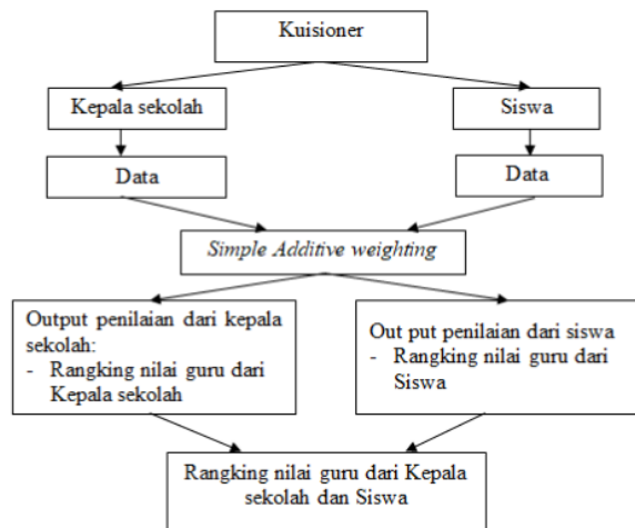
Gambar 1. Alur proses penilaian kinerja guru

Skenario proses pengukuran kinerja guru dapat dilihat pada Gambar 1. Skenario dan kriteria yang digunakan disepakati dari hasil wawancara dengan stakeholders. Kedua perspektif baik dari kepala sekolah (60%) maupun dari siswa (40%) memperkaya penilaian kinerja guru.