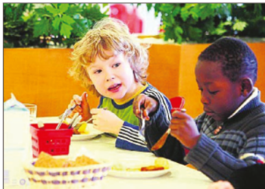
Kaikilla lapsilla on Suomessa oikeus päivähoitoon.

On vaikeaa löytää oikeudenmukaista ratkaisua päivähoi-