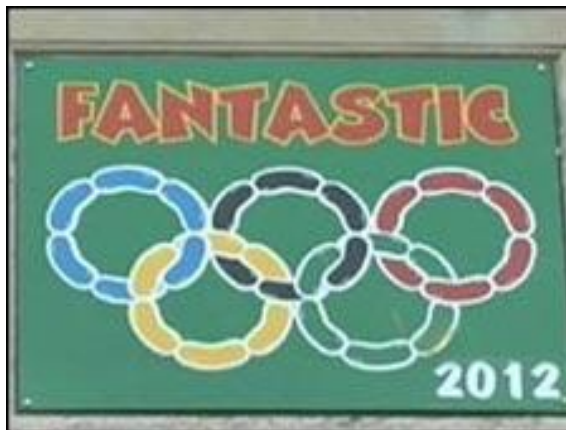
Kuva 3. Olympialaisten hyödyntäminen makkaramainoksessa (Wilson 2008).

mukaan he eivät nostaneet syytettä, koska se ei olisi antanut ammattimaista kuvaa heistä. Sen sijaan he panostavat koulutukseen ja tiedonantoon esimerkiksi stadioneilla kiertävien ihmisten avulla. (Wilson 2008.)