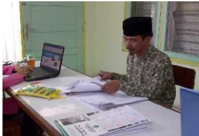
Gambar 1 Proses Seleksi Administrasi

Sumber Dokumen ; Proses seleksi administrasi (pemeriksaan referensi dan latar belakang) yang di kerjakan oleh panitia pelaksana rekrutmen