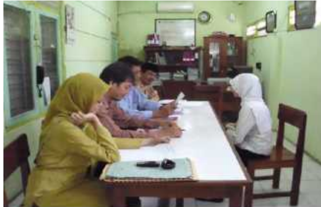
Gambar 2 Proses Seleksi Wawancara

Sumber Dokumen : Proses seleksi Wawancara yang dilakukan oleh panitia pelaksana rekrutmen