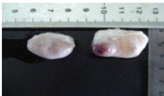
Gambar 1. Ovarium dan ukuran folikel kerbau

Penelitian ini menggunakan media TCM-199 (Sigma), dan suhu dalam inkubator CO2 berkisar 38°C, kualitas dari oosit yang digunakan adalah kualitas A dengan tanda-tanda oosit dikelilingi oleh sel kumulus yang kompak, sitoplasma yang homogen dan umur dari oosit tersebut setelah diambil sampai selesai dikoleksi tidak lebih dari 6 jam. Sumber serum sapi pesisir yang digunakan adalah serum sapi pesisir pada fase berahi. Oosit kerbau yang digunakan pada penelitian ini menggunakan oosit dari ukuran besar dari 5 mm dan dapat dilihat pada gambar di bawah ini.