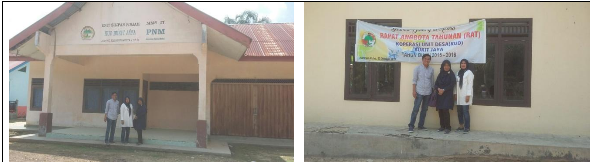
Gambar 6. Wawancara dengan Ketua dan Badan Pengawas KUD Bukit Jaya