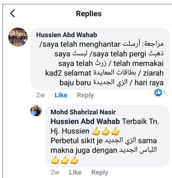
Rajah 5: Paparan Interaksi Respons daripada Pendengar

Respons atau maklum balas daripada pelajar amat penting dalam usaha untuk mencapai objektif PdP yang dijalankan. Sikap pasif pelajar yang tidak memberi maklum balas dalam kelas pembelajaran tidak membantu pelajar untuk menguasai ilmu pengetahuan. Sikap pasif ini dapat dilihat apabila pelajar hanya mendengar pengajaran guru dalam kelas. Mereka tidak banyak menegemukakan soalan, tidak berinteraksi dengan guru dan dengan sesama pelajar, tidak membuat persediaan untuk belajar dan tidak banyak bercakap dalam kelas (Rosni, 2012). Keadaan inilah yang sering dikaitkan dengan proses PdP secara konvensional yang menampakkan jurang interaksi yang ketara antara guru dengan pelajar (Robiah & Nor Sakinah, 2007). Oleh itu, pemanfaatan ruangan Live Video dalam Facebook® membuka ruang yang luas untuk pelajar berinteraksi dengan guru. Pelajar boleh memberi respons tentang kandungan pelajaran dan ia dapat diulas oleh guru secara spesifik sepertimana yang ditunjukkan pada Rajah 5 (Facebook® Radio Malaysia Terengganu FM, 2019a). Inilah antara penambahbaikan yang dapat diketengahkan bagi memastikan terdapat hubungan yang positif antara guru dengan pelajar. Interaksi ini sekaligus dapat menjadikan proses PdP berjalan dengan baik untuk mencapai objektif yang ditetapkan.