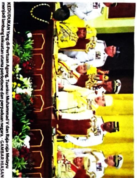
KEDUDUKAN Yang di-Pertuan Agong, Tuanku Muhammad V dan Raja-raja Melayu menjadi lambang ketahanan istana perdatome dan perpaduan negara. - GAMBARAN HIASAN

Di peringkat Persekutuan, Perdana Menteri mengadap Yang di-Pertuan Agong sebelum mesyuarat Kabinet saban minggu. Ia adalah antara ruang yang diberikan oleh amalan Perlembagaan, trigritite convention itu.