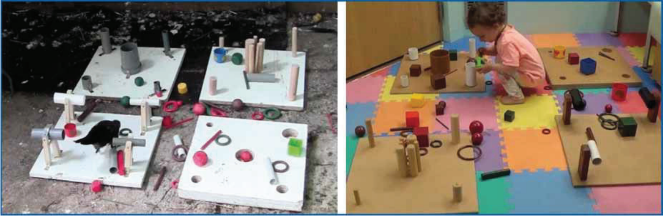
Figure 4. Bébé choucas ( gauche ) et bébé de 18 mois ( droite ) jouant avec le même set d'objets utilisé pour cette étude, composé d'items en bois et en plastique.

pré-existantes entre les bébés dans la quantité et la nature des actions de combinaisons d'objets, même au sein du plus jeune groupe d'âge de 15 mois. Cette limite d'âge basse de 15 mois a été délimitée d'après la littérature indiquant que les bébés n'utilisent généralement pas d'outils dans un contexte de résolution de problème avant l'âge de 18 mois (Fagard et al, 2014). Cependant, les bébés commençant généralement à combiner des objets plus tôt au cours de la première année de vie, il serait intéressant de répliquer cette étude sur une base longitudinale et avec des bébés plus jeunes.