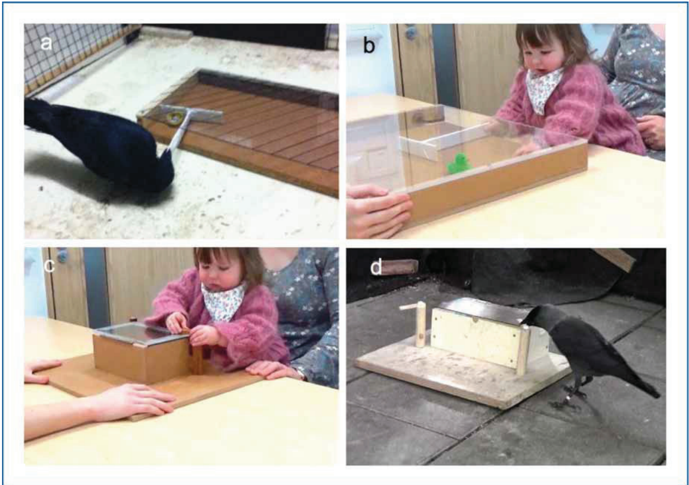
Figure 3. Illustration des tâches du râteau et de l'ouverture de boîte, extraites de la série de tâches de résolution de problèmes. (a) Jeune corbeau de NC utilisant un râteau pour récupérer une récompense sous forme de nourriture hors d'une boîte. (b) Bébé de 21 mois essayant de récupérer un jouet avec la main gauche tout en tenant le râteau dans sa main droite. (c) Le même bébé retirant un verrou bloquant le couvercle d'une boîte avant de réussir à soulever le couvercle pour récupérer un jouet. (d) Choucas adulte retirant le même verrou avant de réussir à ouvrir la boîte.

résoudre cette série de tâches, afin d'en vérifier la pertinence pour des espèces aussi différentes que l'humain et les corbeaux. Dans l'étude finale, les bébés de chaque espèce étaient également exposés à une séance de jeux avec une sélection d'objets ( Figure 4 ), certains bébés étant exposés à des démonstrations de combinaisons d'objets par un expérimentateur humain (groupe « Comb »), tandis que les autres bébés recevaient des démonstrations de simples manipulations d'objets sans combinaisons (groupe « NoComb »). La nature de ces démonstrations n'a cependant pas eu d'effet sur les comportements de combinaisons pendant les sessions de jeu chez les bébés choucas non utilisateurs d'outils. Conformément à notre hypothèse de départ concernant cette espèce non utilisatrice d'outils, nous n'avons pas observé de différence de performance dans la