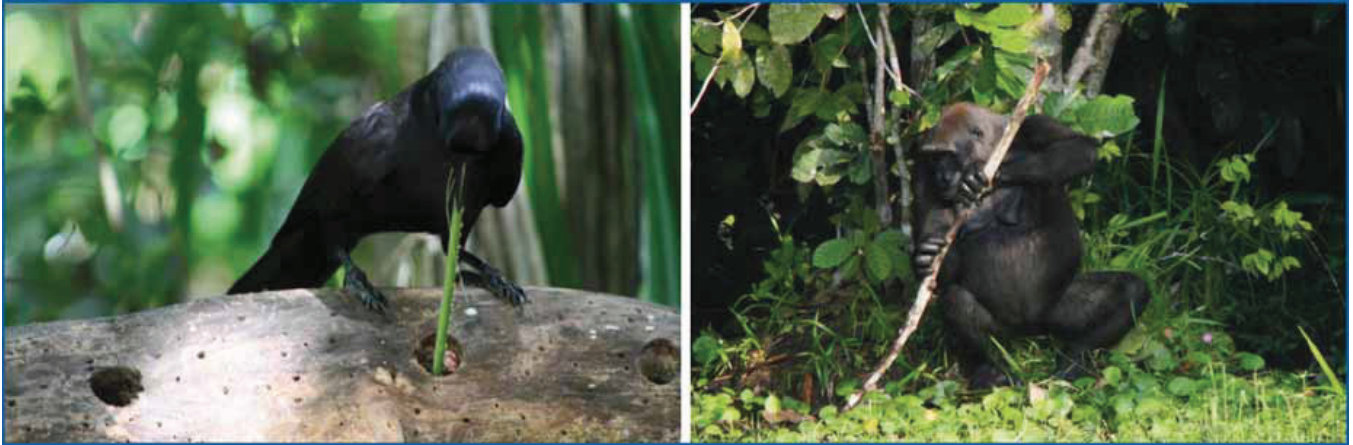
Figure 1. Left: New Caledonian crow using a twig-tool to retrieve food from inside a dead tree; Right: Gorilla using a branch to test depth of water.