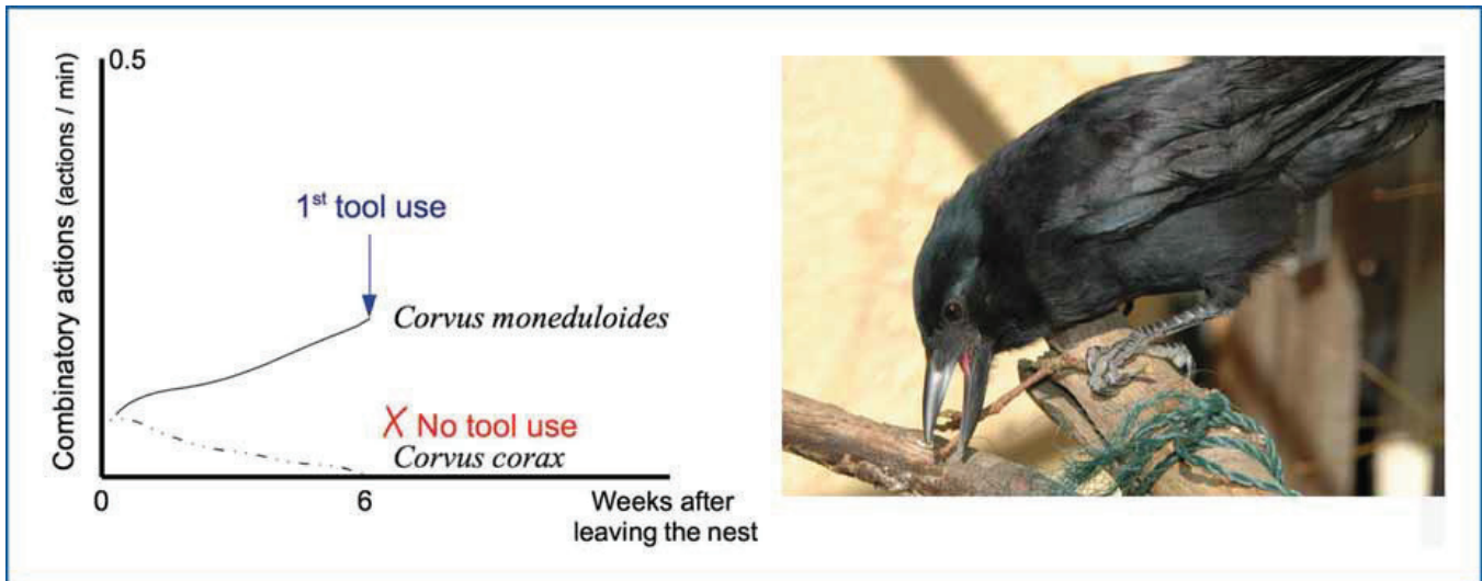
Figure 2. Left: The development of precursor combinations in four NC crows (line) and twelve common ravens (dashed line); adapted from Kenward et al (2011). Right: Baby NC crow spontaneously exploring a stick with her beak while holding it with the foot. During their long juvenile period of about 2 years, young NC crows are often seen exploring their surroundings while holding a thin stick in their beak, sometimes combining the stick with the substrate. These kinds of species-specific typical behaviours are suggested as precursors for the acquisition of later tool-oriented behaviours.

performed by non-tool-using species. For instance, common ravens ( Corvus corax ), a bird species that do not routinely use tools, spend as much time in object manipulations and combinations at the early stages of development as do NC crows. However, a comparative study showed a significant difference in the persistence of combinatorial behaviours: their amount significantly decreased and almost disappeared across development in common ravens, contrary to the NC crows ( Figure 2 left ).