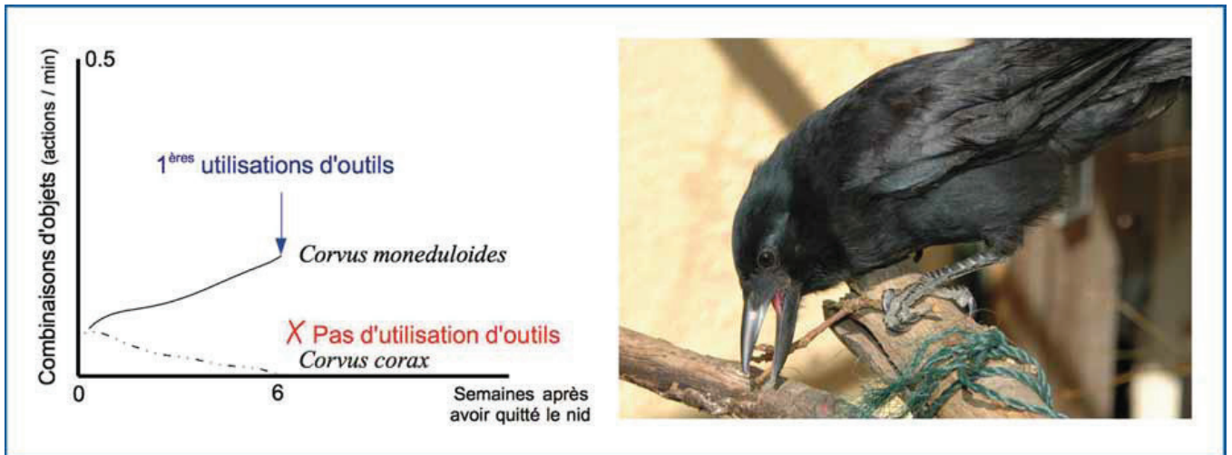
Figure 2. Gauche : Développement des actions de combinaisons d'objets chez quatre bébés corbeaux de NC (ligne continue) et douze bébés Grands Corbeaux (ligne pointillée) ; adapté de Kenward et al (2011). Droite : jeune corbeau de NC explorant spontanément une brindille avec son bec tout en le maintenant avec sa patte. Pendant la longue période juvénile d'environ 2 ans, les jeunes corbeaux de NC passent beaucoup de temps à explorer leur environnement tout en portant une brindille dans leur bec, combinant parfois cette brindille avec diverses surfaces. Ce type de comportements, spécifique à l'espèce, a été proposé comme un précurseur de l'acquisition des comportements d'utilisations d'outils.

Comparer les trajectoires développementales des espèces utilisatrices d'outils avec celles des espèces qui n'en utilisent pas, mais qui sont proches phylogénétiquement et qui ont un système social et cognitif similaire, est une approche fondamentale pour mieux comprendre les schémas développementaux de l'utilisation d'outils. Cependant, ne s'intéresser qu'aux comportements d'utilisations d'outils pourrait entraîner un risque de sous-estimer les capacités des espèces non utilisatrices d'outils. Idéalement, on mesurera donc les différences et les similitudes très tôt au cours du développement, jusqu'à l'émergence des comportements d'utilisation d'outils. En parallèle, seront étudiés d'autres comportements de résolution de problèmes n'impliquant pas l'utilisation d'outils mais comportant une difficulté similaire (par exemple, comportant un nombre similaire d'actions à effectuer pour résoudre la tâche, un but similaire, un taux de difficulté proche, etc). Dans une étude pionnière, nous avons comparé le développement de bébés de deux espèces proches de corvidés (le corbeau de NC, utilisateur d'outils, et le choucas des