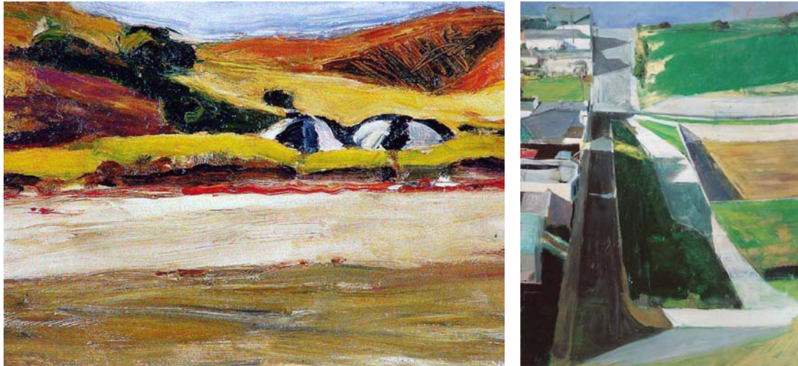
Imagen 5 y 6. Richard Diebenkorn: Playa con sombrillas . Paisaje Urbano I (1963)

vez intuía, como nos ocurre a los espectadores, que en aquellas imágenes falta algo. Para convocar la experiencia de aquellos paisajes ha introducido a estos pequeños trucos electrónicos visuales y sonoros. Llegados a este punto finalmente ya sabemos qué es lo que aporta la factura manual de la imagen pictórica a pesar de todas las contingencias y dificultades que le son inherentes. Para explicarlo acudamos a las obras del pintor norteamericano Richard Diebenkorn. 27