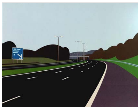
Imagen 3 y 4. Julian Opie: Radio, viento y neumáticos (2000) Sueño que estoy conduciendo mi coche (2002)

Julian Opie aprovecha los textos que sirven de título a estas colecciones de imágenes para describir las sensaciones y las experiencias de aquellos lugares. En ellos relata sus vivencias personales cuando captó las fotos, la geografía, el ambiente y la meteorología de aquellos escenarios. En otras obras similares como Motores, voces y pasos de 1999 o Radio, viento y neumáticos de 2000 (Imágenes 1 y 3) recurre a la reproducción de los sonidos captados en esos parajes. El espectador puede ver las impresiones digitales tipo C-Print mientras escucha el ambiente sonoro de los paisajes. En otros casos introduce diferentes dispositivos que pueden ser electrónicos, por ejemplo diminutas bombillas en los brillos de las imágenes, o digitales, produciendo pequeñas variaciones y sutiles efectos de animación en video. Formalmente las imágenes de Opie son paisajes, reconocemos nuestro lugar frente a esos escenarios pintorescos, sabemos donde está el horizonte e imaginamos cuantos planos de color tendríamos que recorrer hasta llegar a sus extremos. En la pequeña escala en la que vemos estos paisajes impresos en los catálogos nos parecen imágenes análogas a las de cualquier pintor. Pero sin embargo llama profundamente la atención que el autor haya tenido que añadir los textos descriptivos, los sonidos, los dispositivos electrónicos y finalmente las animaciones digitales. Tal