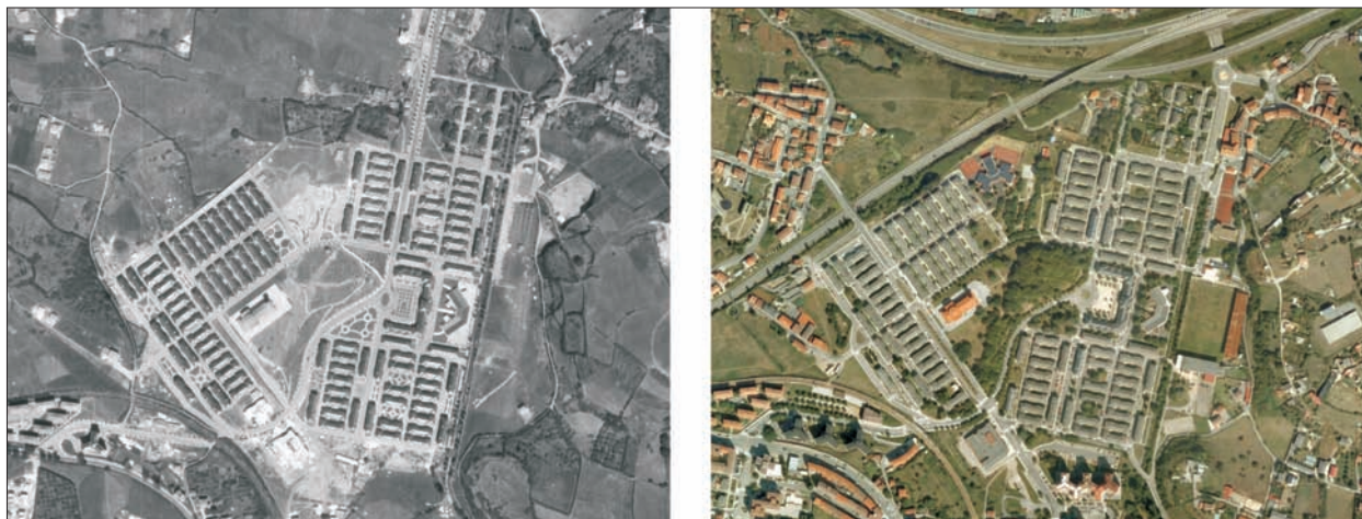
FIG. 15. A pesar de su carácter de «poblado» para alojar obreros cualificados de la Empresa Nacional Siderúrgica (ENSIDESA), el carácter paternalista que impregnaba este tipo de iniciativa franquista en 1951, Llaranes no deja de ser un buen ejemplo de «ciudad-jardín vertical», en la que unas dos mil personas que se asentaron en 1958 podían gozar de muchos más metros cuadrados de zona verde que los habitantes del «Avilés de siempre», de la que distaba dos kilómetros. Tiene la impronta del arquitecto Secundino Suazo, aunque no fuera el proyectista, y mantiene aún hoy la fisonomía de otras zonas urbanas levantadas al amparo del diseño urbanístico y arquitectónico de las Regiones Devastadas. Actualmente, el poblado de Llaranes está integrado en la malla urbana avilesina, como se aprecia en la segunda foto, aunque siga manteniendo el carácter de pueblo con todos los estándares urbanísticos, dentro de una ciudad. Escala aproximada 1:11.900.

según promotor, tamaño, situación geográfica, composición morfológica, grado de confort, etc. Tal y como señalamos en el capítulo anterior, haría falta un estudio caso por caso para determinar la fecha en que fueron introducidos los elementos verdes, cuando los hay. Las barriadas de las que se poseen datos no tuvieron en general jardinería al menos hasta los años setenta, cuando no en época ya plenamente democrática y dentro de los programas de rehabilitación. Verosímelmente esa fue la realidad mayoritaria, aunque hubiese excepciones más o menos numerosas. También a los barrios gijoneses (La Calzada, El Natahoyo) llegaron según GRANDA (2008) los primeros parques a finales de los setenta, en algún caso sobre suelo de antiguas industrias.