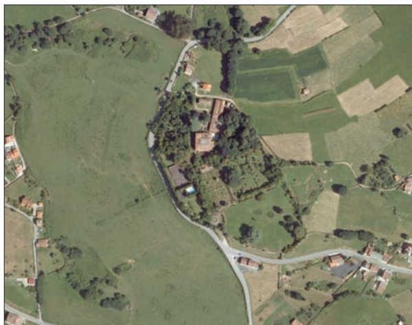
FIG. 5. Situada en la parroquia de Valdesoto, en las afueras de Pola de Siero, la finca que contiene el Palacio del Marqués de Canillejas o de Carreño-Solís, ocupa una extensión amurallada de siete hectáreas, en las que, además del palacio barroco pero muy puro de líneas, existe el mejor jardín histórico o clásico privado de toda Asturias. A modo de oasis de arquitectura y jardinería cultas entre las praderías del agro poleso, la finca amurallada tiene unos jardines extraordinarios, con todo tipo de elementos de adorno, como una pequeña capilla con una cúpula modernista, pabellón de recreo, cenador, parterres, invernaderos, plaza de azulejos esmaltados, jaulas de aves y fieras, palomar, balastradas, una torre sobre la valla, estatuas, y hasta un pequeño ingenio hidráulico para el riego en época de sequías. La bondad del jardín obedece al buen diseño de un maestro jardinero francés, que trabajó para el Palacio a finales del siglo XIX. Desde fuera de los altos muros que cercan la finca es difícil adivinar la hermosura de esta joya de la jardinería burguesa finidecimonónica. Escala aproximada 1:7.750.

Para aliviar la monotonía de los trazados regulares aplicados en la extensión urbana se intercalaron plazas, algunas tan significativas como las circulares o elípticas, que reflejan la atención concedida al factor movilidad. Las hay en Gijón (la de San Miguel, plaza-bisagra coincidente con una punta de estrella de la muralla), en