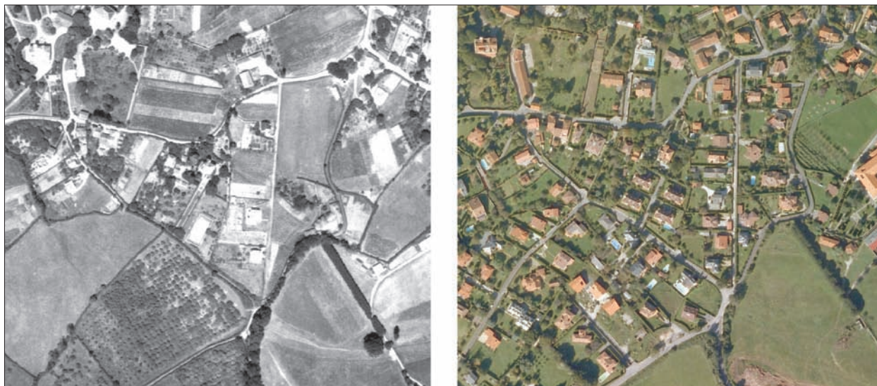
FIG. 7. El ideario de «villa rústica», concebida como quinta de verano, o segunda residencia en los alrededores de las ciudades marítimas como Avilés (Salinas) y Gijón (Somió), está muy bien representado en las imágenes correspondientes a dos periodos bien distintos, separados solo por unas cuatro décadas. En la primera foto aérea se aprecia la inserción discreta de las quintas en el parcelario rústico de Somió, mientras que en la segunda, la presión inmobiliaria y la emulación de muchos nuevos hacendados por poseer una villa en las afueras del Gijón noble y clorófilo, se ha reflejado en la excesiva parcelación tradicional para alojar a estos conjuntos, cada vez con parcelas más pequeñas, de casa y jardín. Escala aproximada 1:6.100.

atesora algunas construcciones de esa naturaleza en la calle Galiana y el Ensanche de Palacio Valdés.