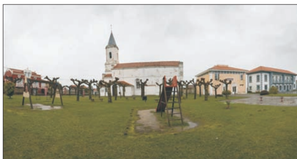
FIG. 11. El pueblo praviense de Somao, que asoma sobre el mar en la rasa comprendida entre los dos núcleos urbanos de Muros de Nalón y Cudillero es, sin lugar a dudas, un pueblo-jardín, pues afortunadamente se ha respetado el esponjamiento de las fincas con casa y «huertos de flor», como se decía antiguamente al jardín. Los indios provenientes de Pravia eligieron esta rasa elevada, con hermosas vistas al mar, para la ubicación de las casas hechas casi todas siguiendo catálogos de revistas francesas de casas de campo, a las que les adornaban con especies florales exóticas, provenientes de América, o no, tales como palmeras, araucarias, yucas, plataneras, castaños de indias, o ágaves, entre otras. Aunque en la imagen aparezcan los plátanos durante el invierno, estos arcos no son propios de la flora «indiana», pero los edificios civiles, que tampoco son de principio del siglo XX, sin embargo sí se han adaptado a la nobleza del resto de los edificios en los que las cercas casi no existen.

Al incremento de la superficie verde ayudó en igual o mayor medida la profusión de edificios con uso no residencial, acompañados por recintos vegetales generalmente no muy amplios que respondían a diferentes funciones. El grupo quizá más significativo fue el de los establecimientos de enseñanza, públicos como el Instituto Alfonso II, los colegios mayores universitarios (San Gregorio y Valdés Salas) y la Facultad de Ciencias de Oviedo, o propiedad de órdenes religiosas. El protagonismo de la Iglesia en el golpe de Estado contra la Segunda República, que desató la Guerra Civil, dio a esa institución un papel muy prominente durante la Dictadura. Su reflejo fue la multiplicación de los colegios católicos, por reforma y ampliación de los preexistentes o mediante obra nueva, sustentada a menudo en un gusto colosalista o monumental anacrónico. Entre las decenas de conventos y centros educativos podrían nombrarse el colegio San Fernando de Avilés, los Jesuitas de Gijón, las Ursulinas de Oviedo y las Dominicas en Sama de Langreo. Sus jardines o recintos arbolados variarían, desde el simple claustro o el breve jardín-vestíbulo hasta la superficie boscosa envolvente, para dar idea de inmersión en la naturaleza. Éste era un rasgo diferenciador de los colegios que abandonaron el centro de las ciudades para buscar grandes fincas en zonas de calidad ambiental o en periferias residenciales exclusivas. La omnipresencia de la Iglesia tuvo otros exponentes como