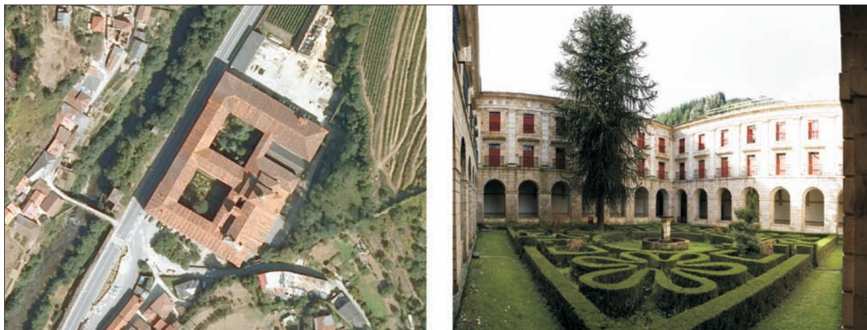
FIG. 1. En primer término, vista aérea del Monasterio de Corias, monumental edificio iniciado en 1022 por los condes Pipiolo y Aldonza, cedido dos décadas más tarde a los monjes benedictinos, los cuales cubrieron en sus alrededores la mayor mancha de viñedos de Asturias. Tras varios incendios a lo largo de su extensa historia, su factura actual es debida al maestro Ferro Caaveiro en 1774, guardando una estética herreriana que le asemeja a El Escorial. La otra imagen muestra uno de los dos patios o claustros, en el que aún se mantiene la técnica de la topiaria versallesca, con el boj podado en hermosas formas geométricas; en el centro del cuadrado se sitúa un pozo, más funcional que plástico, y en un lado, se levanta el primer ejemplar de araucaria traído a Asturias en el siglo XVIII, ya con un porte extraordinario. El edificio será abierto en breve como parador nacional. Escala aproximada 1:3.400.

(Barcelona). Las formas del verde urbano o periurbano también se vienen modificando rotundamente con la irrupción de la ciudad difusa, que incrementa la componente natural a base de jardines privados, pero también puede empobrecer o no tratar satisfactoriamente los espacios públicos (ZOIDO y otros, 2000).