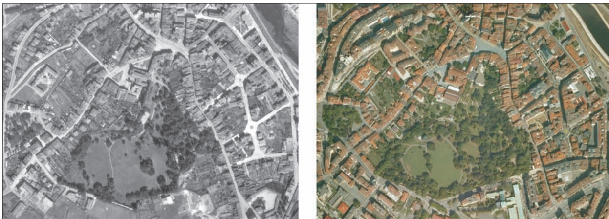
FIG. 4. La venta al ayuntamiento de la parcela del Palacio del Marqués de Ferrera por parte de los descendientes de sus absentistas propietarios en 1976, permitió que la villa de Avilés contara en pleno centro urbano con uno de los mejores jardines públicos de Asturias. Situada justo enfrente del edificio consistorial, y flanqueada hacia el sur por las hermosas calles asoportaladas de Rivero y Galiana, la parcela del palacio y sus jardines se ha convertido en un espacio público que realza aún más el casco urbano medieval mejor conservado del norte de España. El Jardín del Marqués de Ferrera tenía un diseño muy inglés, con mucho césped y pocos árboles, aspecto este que aún mantiene, aunque sumándole el mobiliario y los caminos peatonales pertinentes; carece de los atributos arquitectónicos, salvo un coqueto templete de música, y acuáticos de los otros grandes parques asturianos, pero ha abierto la ciudad en todas las direcciones, a pesar de estar rodeado de edificaciones, o por una ronda, al sur, que pudiera dificultar su accesibilidad. Con una mayor visión de futuro, y tal como observamos comparando las dos imágenes, se perdió una oportunidad para su ampliación hacia el SO mediante la acumulación de las obligadas cesiones de espacio al ayuntamiento derivadas de las actuaciones urbanísticas. Tras el Palacio, hoy convertido en hotel, se encuentra un coqueto jardín versallesco, de propiedad privada, pero fácil de aprehender visualmente. La mayoría de la población forestal es autóctona, pues desde el siglo XVIII apenas tuvo interés botánico para sus sucesivos propietarios, todos con residencia en la Corte madrileña. Escala aproximada 1:10.200.

su carácter de cañada, es una fundación del siglo XVII destinada a pueblo de colonos. Su estructura se resuelve mediante un largo brazo formado por treinta y dos propiedades que conservan, a la trasera de las casas, un gran tapiz verde (huertos, jardines, pradería) fraccionado en estrechas tiras. Ese fondo de manzana, mas su frente edificado con soportales, define uno de los conjuntos más interesantes del Barroco asturiano (TOMÉ, 2006). En cambio, los antiguos huertos eclesiásticos prácticamente desaparecieron del medio urbano con la Desamortización, y los asociados a casonas solariegas sólo permanecen en la Asturias rural, como el que enmarca por la espalda el dieciochesco palacio de Camposorio (Piñera, Navia).