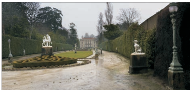
FIG. 6. En lo alto del pueblo pesquero de Cudillero, en el pago denominado El Pito, se encuentra el conjunto monumental de Los Selgas, presidido por un discreto palacio neoclásico encargado por Fortunato Selgas. El frente del edificio tiene unas escalinatas que sirven para entregarse al jardín francés ideado por el maestro Grandport; casi un siglo después de su construcción, la topiaria de las villas renacentistas toscanas interpretada y adaptada por André LeNotre para Versalles, aparece lustrosa en este jardín, adornado por estatuas, macizos florales, y fuentes que cumplen con los cánones impuestos por LeNotre. Detrás del palacio, se da un giro copernicano en la técnica jardinera, pues en torno a un lago, se dispone una gama amplia de árboles de distinta procedencia. El conjunto monumental se completa, rodeado por una magnífica valla metálica diáfana, con un grupo escolar de gran porte, donado al pueblo en 1915, una pequeña iglesia privada, una escultura de bronce en honor de los Selgas, y un pabellón que acoge una colección de tapices.

en evidencia que a menudo estuvieron conectadas con la creación o rectificación de concejos, y por tanto capitalidades. Mención aparte merece Trubia, por el significado de su plaza principal dentro de una fundación ex nihilo vinculada a la industria del Ramo de Guerra. Amén de aquellas plazas ajardinadas o al menos arboladas, en algunas cabeceras comarcales irían estableciéndose verdaderos parques (Pola de Siero, Salas), jardines como el de Pravia (lateral al palacio de Moutas y la Colegiata) y paseos marítimos como el de Llanes.