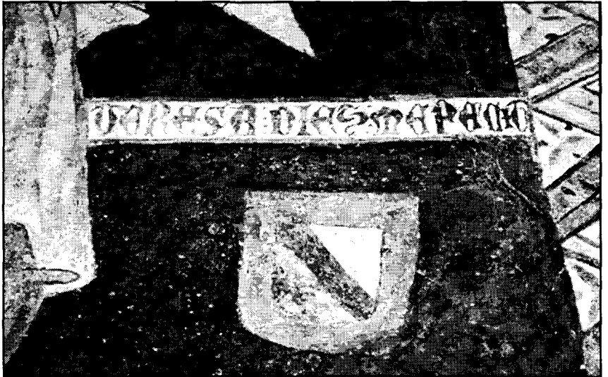
La autoría de Teresa Díez

Dentro de España podemos destacar a Teresa Díez, conocida por su firma en los frescos de santa Clara en Toro, Zamora (1316). Estos frescos fueron descubiertos y retirados de Santa Clara en 1955 y, después de un período de almacenaje y conservación, fueron colocados de cara al público en la iglesia de San Sebastian. Se considera uno de los monumentos del gótico más grandes y significativos que existen en España.