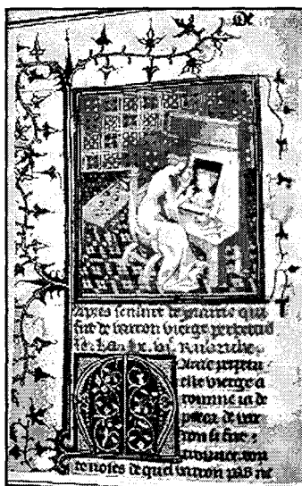
De las imágenes que acompañan a la obra de Boccaccio: De claribus mulieris.