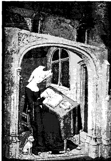
Christine de Pizán

2. Se establece el reconocimiento y autorreconocimiento de la propia autoridad femenina intelectual individual, a través del autorretrato, hecho muy destacable en esta época, de las artistas como Heralda de Hohenburg, Hildegarda de Bingen o Christine de Pizán, entre otras .