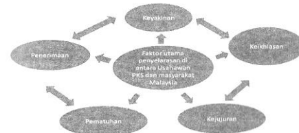
Rajah 2: Faktor Utama Penyelaras Antara Usahawan PKS dan Masyarakat Malaysia berasaskan Paradigma Tauhid

Kajian ini berjaya mengkaji faktor-faktor yang membawa kepada keharmonian antara usahawan PKS dan masyarakat Malaysia. Terdapat lima unsur yang telah dikenal pasti berdasarkan paradigma Tauhid iaitu kepastian, ikhlas, jujur, pematuhan dan penerimaan. Rajah 2 menunjukkan dimensi yang diperolehi daripada kajian ini. Setiap unsur memainkan peranan integriti menurut ibadah Tauhid dengan amanah dan menepati konsep keimanan yang ditetapkan. Keputusan dan perbincangan adalah berdasarkan paradigma berkeadilan melalui kaedah temu bual dengan lima pemberi maklumat di seluruh Malaysia. Kajian lanjutan boleh menggunakan instrumen yang lebih terperinci dan menyeluruh serta mengumpul lebih banyak maklumat daripada pelbagai informan.