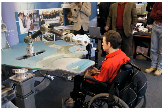
Figura 5. ASIBOT, robot de asistencia a personas discapacitadas (UC3M).

hay algunas compañías comerciales que ofertan robots de vigilancia en las casas, que pueden recorrer las distintas habitaciones o los alrededores de una vivienda detectando la presencia de intrusos e identificándolos. Tienen dispositivos de locomoción, normalmente con ruedas, y un sistema de comunicaciones que permite ser programado desde un lugar remoto y enviar información de sus sensores o imágenes a un puesto de control en la vivienda o a un teléfono programado.