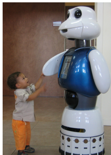
Figura 6. Maggie, robots de educación y entretenimiento (UC3M).

synthesizers and voice recognizers for communication. All this with the objective of achieving a high degree of interaction.