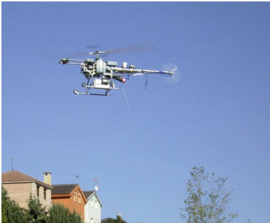
Figura 3. Robot helicóptero para inspección y vigilancia (UPM).

Igualmente en sistemas de locomoción hay que citar los robots submarinos con capacidad de desplazarse en el agua (ver Fig. 4) (Aracil et al. , 2005, Ridao et al. , 2001). Igualmente los robots aéreos con capacidades de volar (ver Fig. 3) (del Cerro et al. , 2006, Ollero et al. , 2006), robots trepadores y deslizantes (Balaguer et al. , 2006).