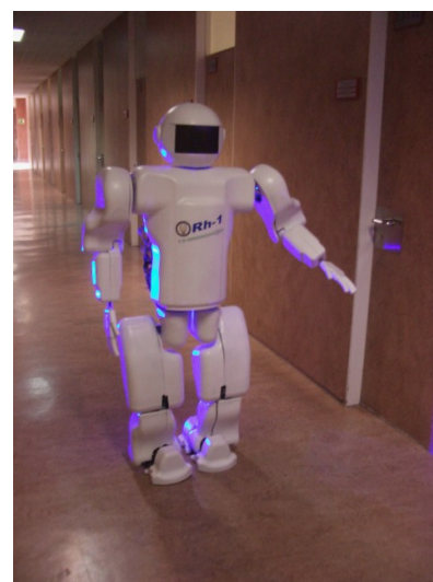
Figura 9. Rh1, robot humanoide de tamaño natural (UC3M).

Hay temas para hacer esto realidad que aún requieren un desarrollo tecnológico importante, aunque ya se han dado bastantes pasos en esa dirección. Se trata del desarrollo de lo que podríamos denominar los cerebros de los robots. Estos deben ser procesadores con capacidad de realizar las mismas funciones que los cerebros humanos. Es claro que en capacidad de memorizar datos y en rapidez de procesado los equipos de cálculo superan las capacidades de nuestro cerebro. También se han dado pasos importantes en el desarrollo de sistemas con capacidad de razonar y tomar decisiones sobre una situación concreta: en este sentido tenemos los sistemas de lógica borrosa, los sistemas expertos y las redes neuronales.