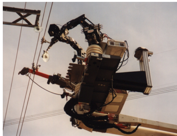
Figura 2. ROBTET, robot para el mantenimiento de líneas de alta tensión (UPM)

Los robots de servicio deben tener también la capacidad de desplazarse para situarse en su lugar de trabajo, a veces situado alejado del puesto de control o en un lugar de muy difícil acceso o situado en un entorno incómodo o peligroso para los humanos (Aracil et al. , 2002; Ferre et al. , 2005) (ver Fig. 2).