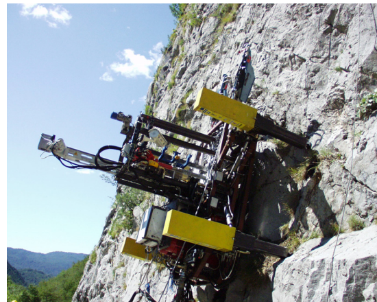
Figura 1. Roboclimber, robot escalador para consolidación de laderas de montañas (CSIC)

estructuras muy robustas, o mini, micro y nanorobots, de dimensiones extraordinariamente pequeñas, capaces de introducirse en cavidades de dimensiones muy pequeñas para realizar tareas complejas (Cavalcanti et al. , 2008; Requicha, 2003).