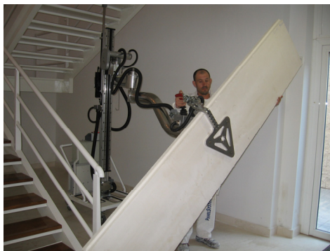
Figura 7. Robotab2000, robot de asistencia para el manejo de cargas elevadas (CSIC).

Técnicamente gran parte de las bases para esta revolución están desarrolladas. Como primer paso será necesario hacer real el uso de los robots de servicio en todas sus aplicaciones (Aracil et al. , 2007; Armada et al. , 2003; Asada y Christensen, 1999). Los trabajos en las minas o en el campo los pueden realizar robots (Armada et al. , 2007). Igual los de la construcción, tanto civil como en edificación (ver Fig. 7) (Balaguer et al. , 2005; González de Santos et al. , 2000; González de Santos et al. , 2008).