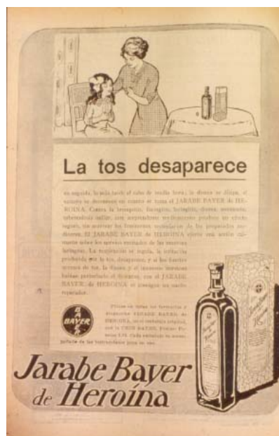
Publicidad del jarabe Bayer a la heroína (préstese atención a cómo se le prescribe a un niño, probablemente con tos o diarrea), entre otras de las virtudes que por aquella época se le atribuían y que, lamentablemente no se aprecian bien en la ilustración. Pero que son: todas las formas de tos: ferina, bronquitis, enfisema, tuberculosis, dolores varios, somnífero y antidiarreico. (Año 1905).

¿Qué cambia entonces la bondad o maldad de una droga? ¿Existen pues, drogas buenas y drogas malas? La morfina –el más beneficioso alcaloide del opio, siguiendo con el ejemplo ¿cambia siendo "buena" si la prescribe o administra un médico diplomado, a ser una maldición si se consigue por medios no ortodoxos y se la (auto)administra la propia persona? La tan denostada marihuana ¿pierde sus indudables virtudes si la cultiva o la compra en un coffee-shop holandés o californiano por ejemplo, un desdichado afectado de leucemia, y deviene milagrosa si su THC (principal cannabinoide, aunque no único) viene prescrito por receta como en específicos como la "nabilona", aún no disponibles según creo, en nuestro país?