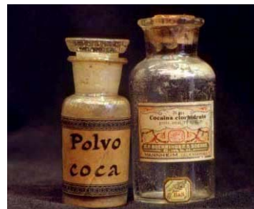
Frascos de farmacia en los años 1900-1910 donde se conservaba cocaína en polvo (presumimos que con efectos anestésicos locales), uno español y otro alemán.

Reiteramos la aseveración de que se vendían en la farmacia puras y, por lo tanto, posibles de medir y a un precio discreto. Ahora se venden en la calle, impuras, por lo tanto, imposibles de medir y a precios desorbitados. ¿Qué dirían si a ustedes o a sus abuelos se les hubiera vendido en una esquina plagada de maleantes una botella de "buen vino" con sólo un 5% de éste y el resto del litro mezclado con agua, (sucia, por cierto), a cinco o diez mil pesetas la botella?