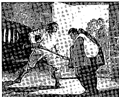
Captura del Maragato per fra Pedro de Zaldúa, de Goya