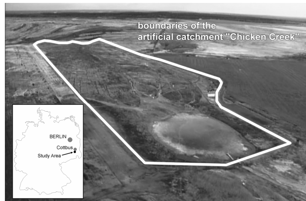
Abbildung 1: Luftbild des künstlichen Einzugsgebiets „Hühnerwasser“ (Februar 2009), gelegen in der Bergbaufolgelandschaft des Tagebaus Welzow-Süd südlich der Stadt Cottbus.

Ziel dieses Beitrags ist die Visualisierung und quantitative Beschreibung des Initialzustandes und der frühen strukturellen Dynamik, beispielhaft dargestellt für das künstlich geschaffene hydrologische Einzugsgebiet „Hühner-