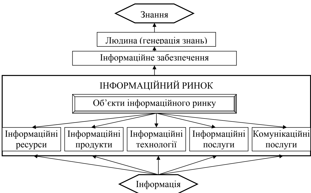
Рис. 2. Місце інформаційного ринку у ланцюгу інформація – знання

є визнання вирішальної ролі інформації для різних напрямів діяльності суспільства.