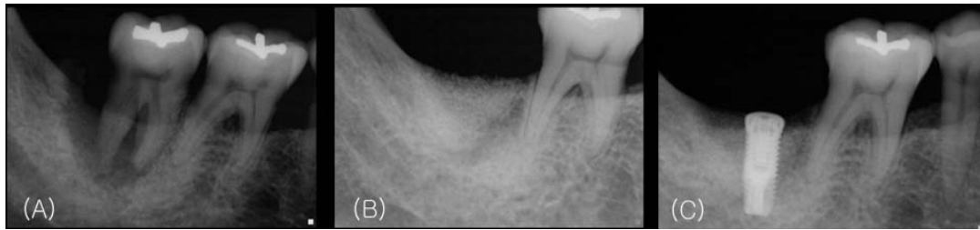
Figure 3. (A) Before extraction (B) 6 months of healing after ridge preservation (C) Implant fixture installation.

존은 임플란트를 심미적인 위치에 식립하거나 상악동 또는 신경을 피해 식립하는데 있어 큰 도움이 되기 때문이다(Fig. 3). 따라서 발치 후 골이식재와 차폐막을 이용한 치조제 보존술은 발치후 나타나는 치조제 흡수를 최소화시키고 추후 임플란트 식립시 임플란트의 위치 선정에 도움이 될 것으로 생각된다.